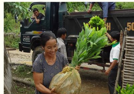
ベトナムでのJICAプロジェクトの様子

森プラを通じて世界の森林について知り、豊かな森を未来に残すためにどんなアクションを起こすべきか、一緒に考えていきませんか？