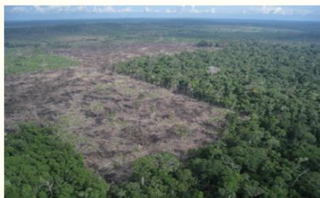
伐採が進むアマゾンの熱帯林

しかし、現在、世界ではかつてないほどの速さで森林の減少・劣化が進んでいます。特にアジアや南米、アフリカなどの熱帯林を中心に、毎年九州の約1.4倍に匹敵する面積(約474万ha)の森林が失われています。このまま森林の減少・劣化が進めば、地球上から徐々に生き物が姿を消し、やがて私たち自身も森林の恵みを享受できず、生活、そして命さえも脅かされていくことになるでしょう。これからも、人々が人間らしく暮らし、生き物に満ちた地球を未来に引き継いでいくために、豊かな森を守り残していくことが必要なのです。