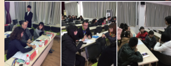
→ 2016 年 12 月 项目赴日调研