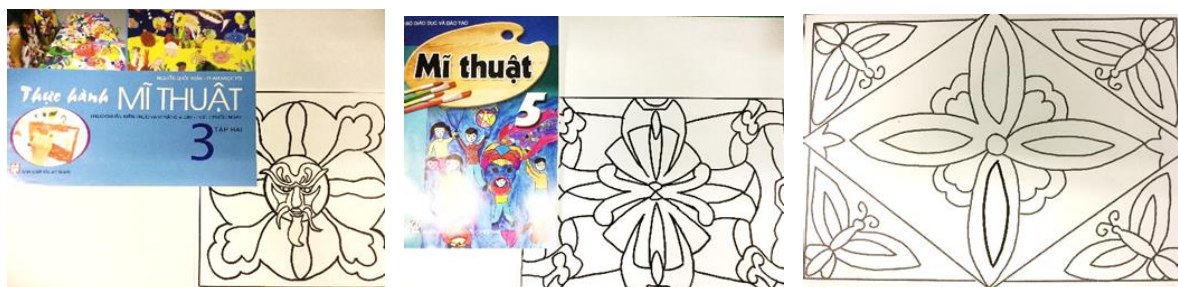
ベトナムの国定教科書の中から教材を選んだ。