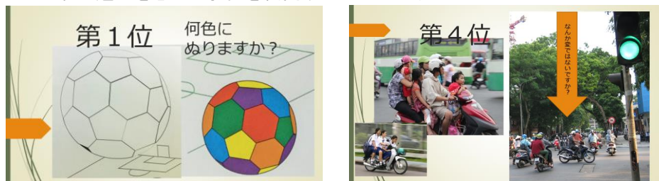
ベトナムの本屋さんで購入したぬり絵の本と現地の様子をとった写真