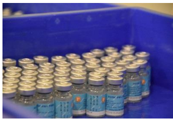
日本の技術協力によって 作られたワクチン