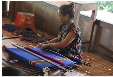
伝統を守るカトウ一族の人々