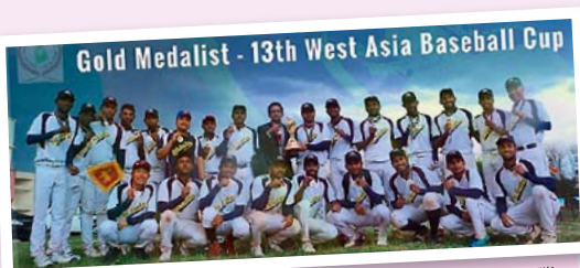
第13回西アジア大会優勝

他にもいろいろな地域のカレッジや社会人の野球チームに指導に行きました。活動自体うまくいかないことが多いですが、子どもたちの笑顔に救われ、活動しています。2月末にパキスタンで行われた第13回西アジア大会で、初