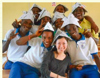
折り紙は授業前のアイスブレイクの定番↑

ガーナで生活をした2年6ヶ月の間、たくさんの素晴らしいことを学びました。万人を愛するガーナ人と接して行