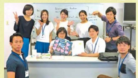
ポルトガル語クラスの皆さんと先生を囲んで

ブラジルは、地球の裏側というイメージとあまり治安が良くないという印象を持っていました。また、歴史の授業でも日系人社会について学ぶ機会がなかったので、正直私も日系人社会に対する知識がほとんどありませんでした。