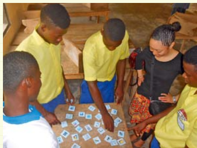
アイコンかるたを使った授業

ガーナの職業訓練校にて、全校生徒を対象にパソコンの基礎を教えてきました。ガーナでは停電の頻度がとても高く、なかなか実践的なパソコンの知識を教えることができません。そこで、電気がなくても実践的な内容を勉強できるように、数々の教材開発を行いました。たとえば「アイコンかるた」。MS Officeのアイコンを1枚ずつカードにし、かるたのようにアイコンの名前を呼んでその絵札をとる、というものです。これは勉強嫌いなガーナ人の生徒たちにも大好評でした。