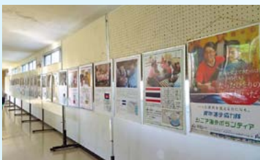
長野県出身のJICAボランティアパネル展

SGH初年度に入学した生徒さんたちが3年生となり、課題研究も形になってきた今、その総括として、6月17日(土)、「北陸新幹線サミット」を開催しました。