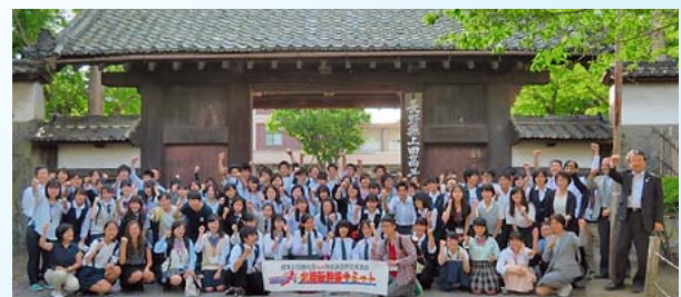
大盛況に終わりました。お疲れ様でした。