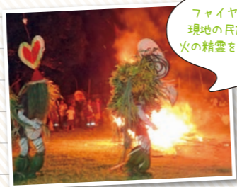
ファイヤードダンス 現地の民族の踊り。 火の精霊を呼んでいる