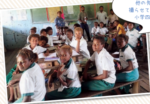
授業風景 他の先生の授業を撮らせてもらいました。 小学四年生の授業。