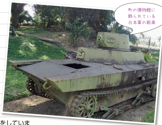
町の博物館に飾られている日本軍の戦車

パプアニューギニアという国を知っていますか？ オセアニア州に位置し、大きさは日本より少し大きいくらいの常夏の島国です。私はその国のラバウルという町で小学校の先生をしています。このラバウルはかつて日本軍がオーストラリアを含む連合軍と戦争していた時の拠点だった町で、今でもたくさんの戦争の残骸(戦車、爆弾、機関銃など)が残されており、毎年、ここで戦死した日本軍兵士の家族が慰霊に訪れています。