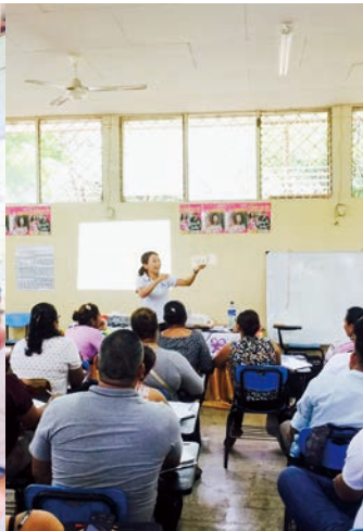
先生への研修会を実施しました