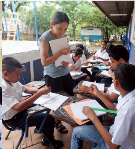
小学校教育隊員としての活動の様子