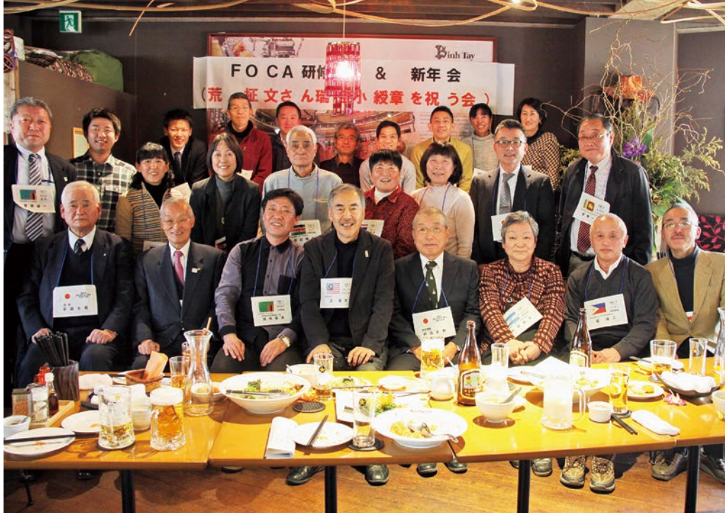
福島県内から多くのOVが集まりました。