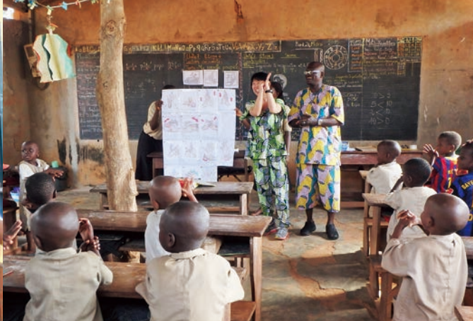
手洗いの歌を生徒と一緒に歌った

私は西アフリカのベナンに青少年活動隊員として派遣されました。配属先は首都ポルトノヴォの教育委員会です。