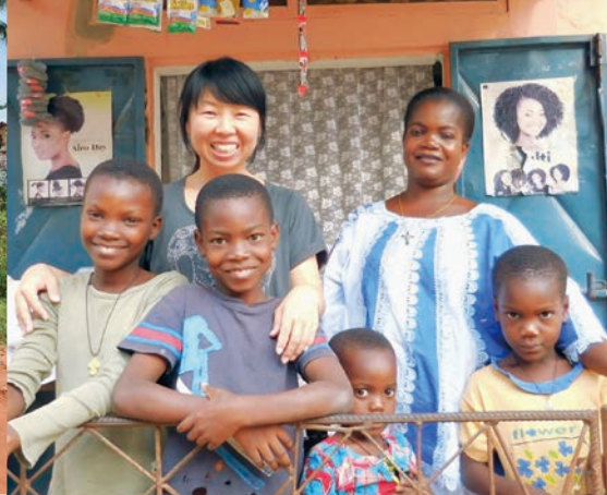
ベナンの子どもたちと②