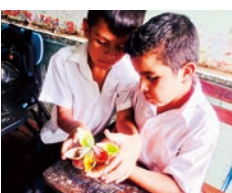
ニカラグアの子どもたち