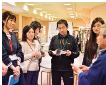
多くの訓練生が「お茶の歴史」に興味を持ち、先生に質問をしていた

2017年11月27日(月)、JICA二本松訓練所で課外特別講座「茶道のいろは」を実施しました。