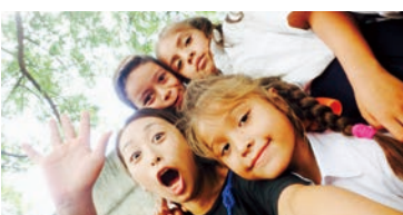
ニカラグアの子どもたちとの一枚