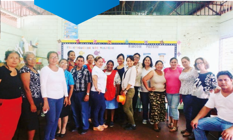
研修会に参加した先生たちとの一枚