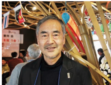
荒 証文 OV

2018年1月14日(日)、郡山市で「ふくしま青年海外協力隊の会」主催の研修会と新年会を開催しました。