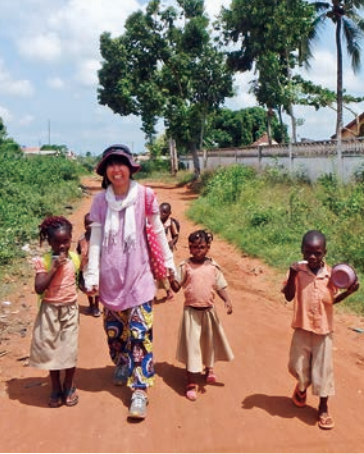
ベナンの子どもたちと①