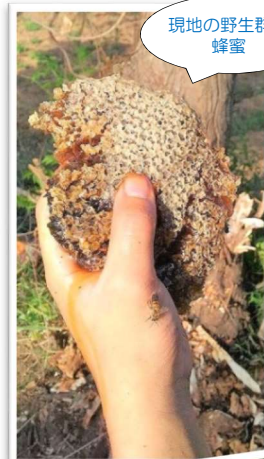
現地の野生群の蜂蜜