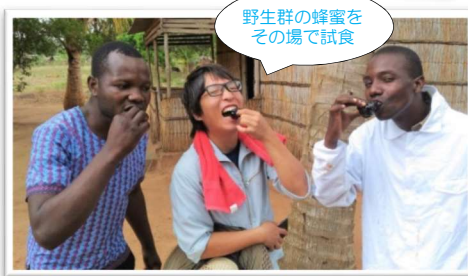
野生群の蜂蜜をその場で試食