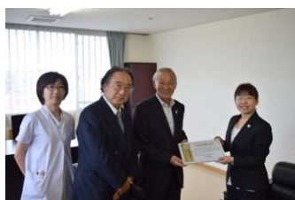
谷理事長と須佐会長へお礼とご報告に