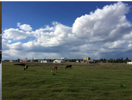
ボルガン県の中央部に広がる草原