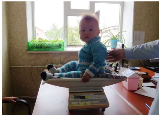
いつもよく使っています！

今回は、本宮市の 谷病院から寄贈 いただいた小児 用体重計が海 を越えて モンゴルま でいったエ ピソードをお 伝えいた します！