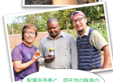
配属先所長と、同任地の隊員が作った現地蜂蜜の新ラベル