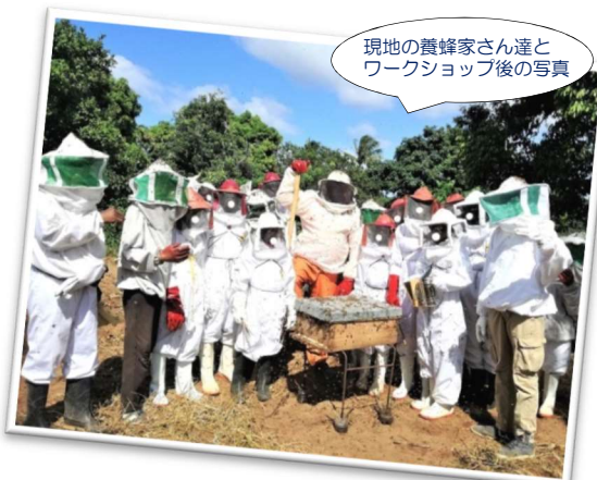
現地の養蜂家さん達とワークショップ後の写真

毎日辛い事もありますが、福島県で培った技術と知識を活かし、地域住民とミツバチと充実した日々を送っています。いつか安達東高校農業コース出身の生徒にも、養蜂隊員として養蜂の技術を活かし、途上国で活躍してもらえる日がくればと密かに願っています。