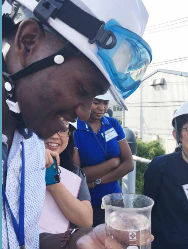
Participants de l'Initiative ABE dans une entreprise de Yokohama Photo Hinode Sangyo Co., Ltd