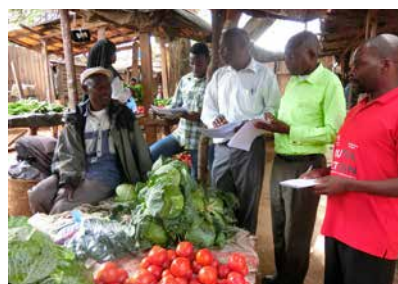
Des agents de vulgarisation agricole effectuent une enquête sur un marché dans le cadre d'un stage SHEP (Malawi)

* Résilience, Industrialisation, Compétitivité, autonomisation (Empowerment)