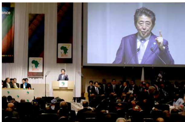
M. Abe a déclaré que le Japon allait faire tous les efforts possibles pour que les investissements privés en Afrique soient encore plus importants que les 20 milliards de dollars investis au cours des trois dernières années. Les entreprises japonaises ont indiqué qu'elles étaient favorables au développement de leurs activités en Afrique.