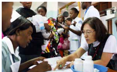
Une volontaire de la JICA fournit des conseils pour les examens médicaux des enfants en bas âge et dirige des stagiaires dans un centre de santé maternelle et infantile (Zambie)

Pour permettre le développement de la CSU, apport d'une coopération financière et technique pour développer les ressources humaines dans le domaine de la santé et renforcer le système d'offre de services de santé ainsi que la base financière, tout en tenant particulièrement compte de la santé maternelle et infantile, de la santé génésique, des maladies infectieuses et des maladies non-transmissibles.