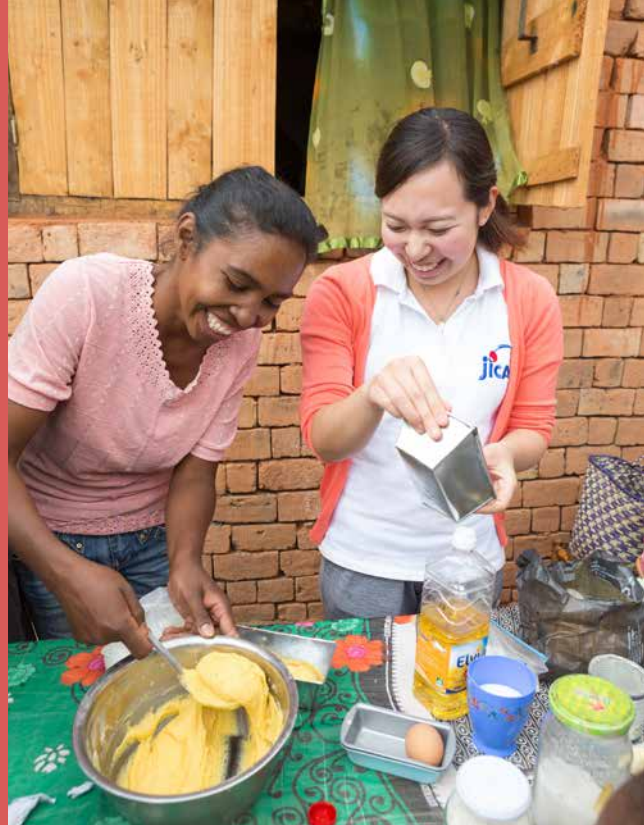
Une volontaire de la coopération japonaise à l'étranger participe à une initiative pour lutter contre le déséquilibre alimentaire (Madagascar)