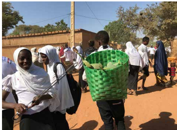
Campagne de nettoyage dans un collège de la capitale Niamey, pour une "ville propre" (Niger)

Dans une Afrique où l'urbanisation progresse rapidement, contribution au développement des villes durable en appuyant au développement des infrastructures physiques et institutionnelles dans les zones urbaines et dans les trois domaines suivants : gestion des déchets, approvisionnement en eau et assainissement et planification urbaine.