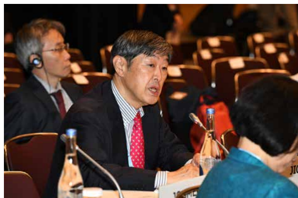
La JICA, avec son président M. Kitaoka et les hauts responsables, a assisté à la conférence et participé à 78 réunions (dont 22 avec des leaders africains et au moins 9 avec des dirigeants d'organisations internationales), organisé 31 événements annexes, conclu plus de 9 mémorandum d'accord, et participé à des événements de promotion, dont « Bon for Africa ».