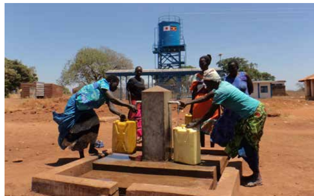
Borne-fontaine publique installée dans le cadre du projet d'approvisionnement en eau pour encourager la réinstallation des déplacés internes dans la région d'Acholi (Ouganda)

En tenant compte du nexus humanitaire-développement, appui à l'autonomisation en collaborant avec l'aide d'urgence et humanitaire mise en oeuvre par des organisations internationales. Appui aux communautés d'accueil des réfugiés et des personnes déplacées. Prévention de la radicalisation des jeunes à travers la création d'emplois.