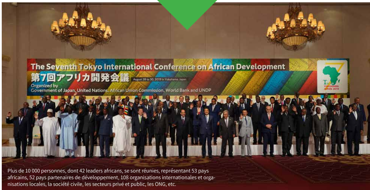
Plus de 10 000 personnes, dont 42 leaders africains, se sont réunies, représentant 53 pays africains, 52 pays partenaires de développement, 108 organisations internationales et organisations locales, la société civile, les secteurs privé et public, les ONG, etc.