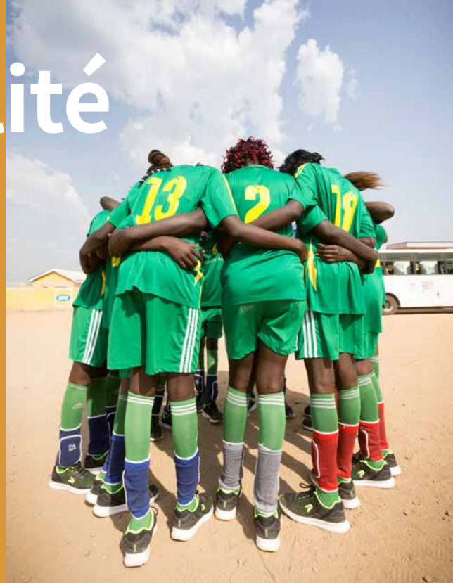
Le tournoi sportif de la Journée d'unité nationale, organisé pour promouvoir la paix à travers le sport (Soudan du Sud)