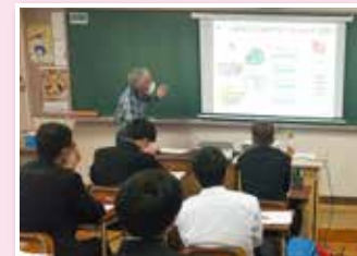
▲県立前橋高校でアフリカでの生活や仕事について話している様子

途上国での経験を活かして、日本の学校等で世界の課題や多様性を伝え、ともに創る未来を考えていく、教育支援事業です。