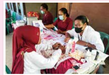
▲人材育成を通じた女性の健康改善プロジェクト (群馬大学/インドネシア)

日本のNGO、大学、地方自治体及び公益財団法人等の団体が、これまでに培ってきた経験や技術を活かし、JICAと協働して途上国への技術協力を実施する事業です。