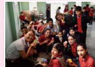
▲教員を10日間途上国に派遣する教師海外研修