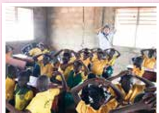
ガーナの算数の授業の様子

群馬デスクでは、教育機関を中心に前出講座の実施や、JICA海外協力隊経験者と自治体連携の国際理解イベントを行っています。今後より多くの皆さまと協力し、群馬県のグローバル化と多文化共生・共創の発展を目指します!