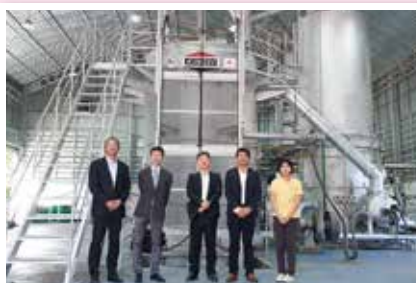
▲「次世代焼却炉による医療廃棄物適正処理」案件化調査・普及実証事業 (株式会社ケンセイ産業/タイ)