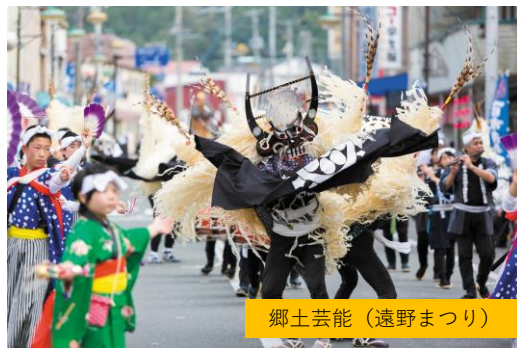
郷土芸能（遠野まつり）