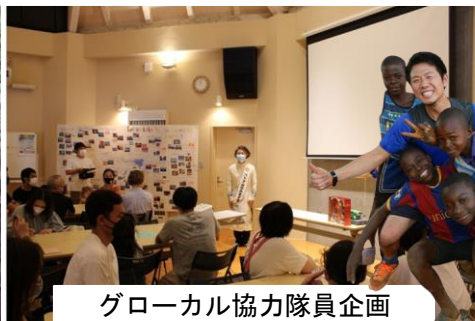
グローバル協力隊員企画 国際交流イベント