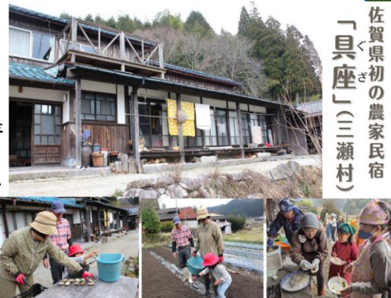
佐賀県初の農家民宿 「具座」(三瀬村)

佐賀市北部中山間地域(富士町、三瀬村、大和町松梅地区)は、「人口減少」、「少子高齢化」が顕著でそれに伴う担い手不足、耕作放棄地の増加、有害鳥獣被害等様々な課題を抱えています。その課題解決のため、地域振興とスポーツ合宿施設の拠点として「富士地域振興センター」の開設、富士しゃくなげ湖(嘉瀬川ダム)での水上スポーツの利活用、空き家バンクを活用した移住者支援を行っています。また、この地域は温泉地としても有名で、市街地から約30分という近さから多くの観光客も訪れます。山あり、川あり、温泉あり。地域の方々も温かく、人情味溢れる自然豊かな地域です。