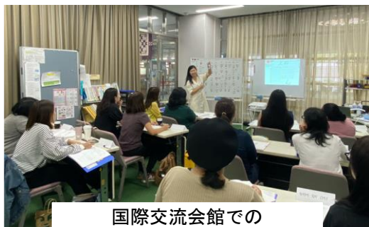
国際交流会館での 日本語教育