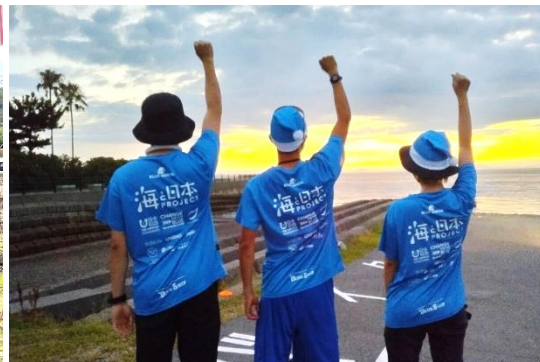
伊予市プログラムへの参加者の声