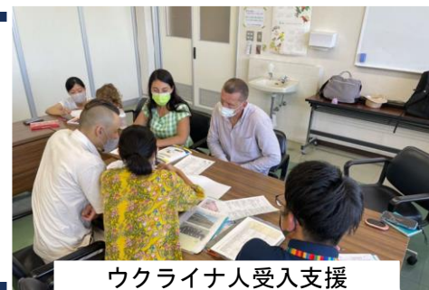
ウクライナ人受入支援

人口約5,200人と小さな町である玉東町は、その恵まれた自然や市街地へのアクセスの良さを強みと捉え、小さな町ならではの機動力で多岐に渡り先進的な事業を展開してきました。駅前を中心とした移住施策やまちづくり企画を初め、ウクライナ避難民支援など多文化共生事業にも積極的に取り組んでおり、未来に向かって挑戦を止まない町です。