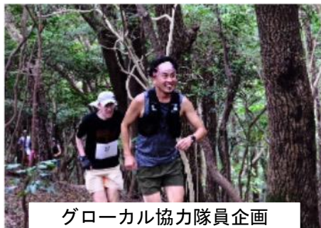
グローバル協力隊員企画 トレイルランニング大会