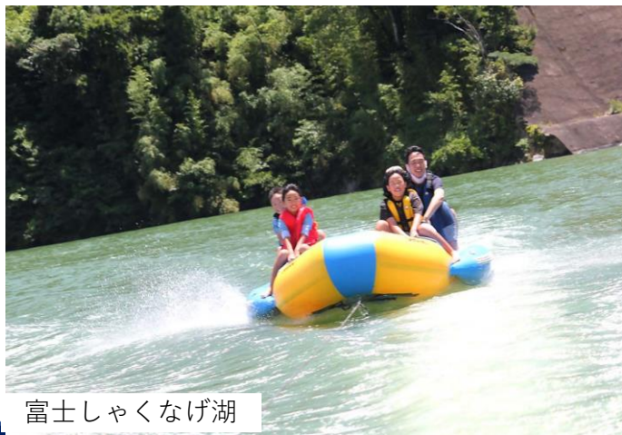
富士しゃくなげ湖