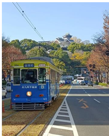
国際交流会館から眺める 熊本城と市電