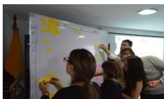
KAIZEN セミナー(キト)ワークショップ