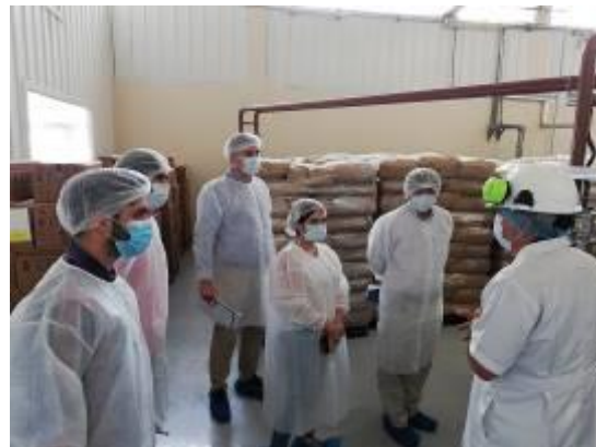
企業訪問(グアヤキル)