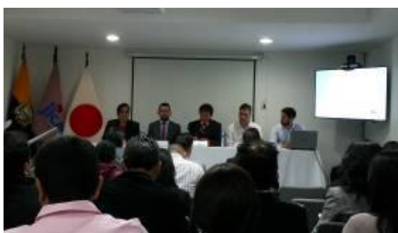
KAIZEN セミナー(キト)開会式

JICA エクアドル事務所はエクアドル国生産貿易投資漁業省 (Ministerio de Producción, Comercio Exterior, Inversiones y Pesca, MPCEIP) と共催で、アルゼンチン国立工業技術院 (Instituto Nacional de Tecnología Industrial, INTI) を講師に招き、中小企業向け KAIZEN セミナーを開催しました。11 月 18 日のキックオフ会合後、19 日キト市にて KAIZEN セミナー、20 日グアヤキル市にて企業訪問、21 日グアヤキル市にて KAIZEN セミナーという日程でしたが、どの会場も盛況で、KAIZEN 手法への関心の高さを表すものでした。