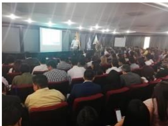
KAIZEN セミナー(グアヤキル)