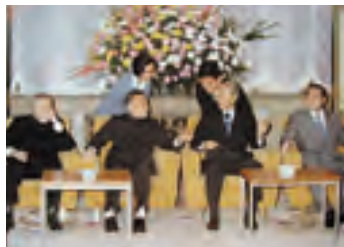
1978年福田起夫首相(当时)会见到访的邓小平副总理(当时)。1979年日本开始对华经济合作

“世界各国都认为应当祝福富国(中国)的现代化政策, 这完全是因为这一政策直接关系到国际协调的核心问题, 并且更加富强的中国的出现可望使世界更加美好; 我国之所以大力推行对中国的现代化进行合作的方针, 不仅有我国自己的考虑, 而且也是由于有这种全世界的期待在做后盾。”