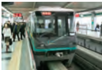
重庆轻轨铁路建设项目

在这些项目中, 有很多诸如北京首都国际机场、北京地铁(1号线、13号线)、北京给排水项目(第九供水厂、高碑店污水处理厂)、上海浦东国际机场、重庆轻轨、武汉长江第二大桥等与百姓生活密切相关的日元贷款项目。另外, 通过无偿资金援助与技术合作实施了一批以北京中日友好医院为代表的直接关系到提高中国人民生活水平的项目。