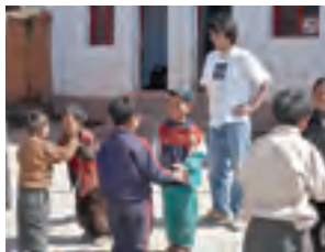
在四川省凉山州工作的青年海外协力队员 (日语教师)

实行改革开放政策的中国的进一步稳定与发展, 日中两国友好合作关系的加强, 对于亚洲、太平洋地区乃至全世界的稳定与发展都是极其重要的。