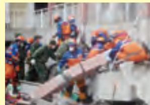
日本国际紧急援助队救援小组的救援场面

2008年5月四川发生大地震后, 作为国外的第一支救援队日本国际紧急救援队抵达中国, 并展开相关救援工作。另外, 日本政府又继续向受灾群众进行了紧急物资援助, 派遣医疗队, 追加物资共给等一系列救援工作。在2011年3月东日本大地震发生后, JICA项目的中方实施机构中国地震局组成了中国紧急救援队派遣到日本。日常的合作所建立的关系为互相帮助打下了基础, 这可以说是一个好的实例。