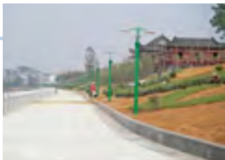
赤壁市的治理项目

我们期待通过本项目的实施能够促进湖北省的社会经济安定以及改善当地居民的生活环境。