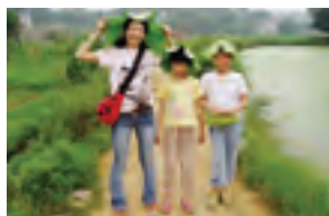
在湖南省开展工作的青年海外协力队员 (幼儿园教师)

随着中国的经济发展, 对华经济合作内容也发生了变化, 现在重点支持解决环境污染、传染病等问题以及增进日中两国人民相互理解领域的项目。