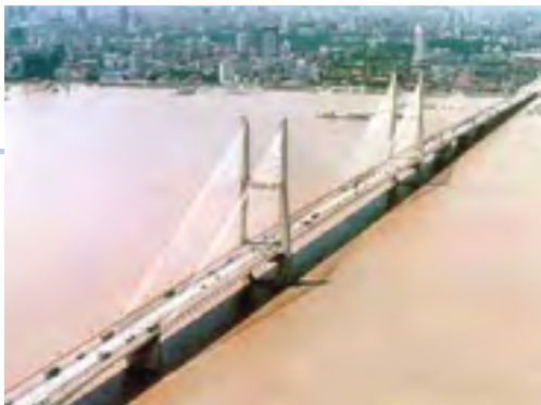
建成后的长江第二大桥

1990年本项目立项时，原有的武汉长江第一大桥车流量已经达到了饱和状态，它成为了武汉市交通拥堵的原因之一。本项目是为了解决上述问题而实施的。于1995年12月竣工。建成后的第二大桥有效解决了交通堵塞问题，对武汉的城市均衡发展起到了积极的作用。（在湖北省除武汉长江第二大桥建设项目外，还实施了黄石长江大桥建设项目）