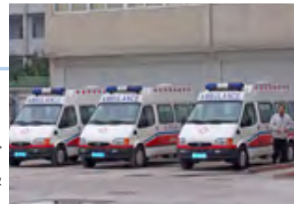
本项目采购的负压救护车

各医院和中心的传染病检查体制的完善有助于将像“非典”那样迅速传播的传染病控制在最小范围内。