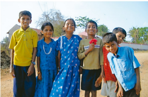
学生時代に訪れたインドで出会った子どもたち

が学校に行くことができ、先生から分かりやすい授業を受けられるよう取り組んでいます。