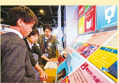
クイズ形式でSDGsについて考えます

あなたは知っていますか。「学校に通えない子どもたちが、世界にどのくらいいるのか」「5歳になる前に、病気で亡くなってしまふ子どもたちがどのくらいいるのか」