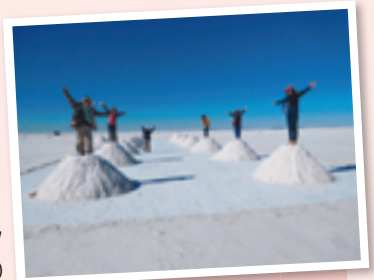
ウユニ塩湖の青い空と塩の山

人々は陽気で穏やか、集まり事には2~3時間の遅刻は当たり前です。車よりバイクが多く、夜の公園を二人乗りで何周もドライブしたり、大音量のラテン音楽に合わせ踊り明かすことがリベラルタの若者流の夜の楽しみ方です。