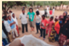
家庭菜園での指導風景

水や電気、食べ物も十分ではないくらいの中、時には過酷な自然を受け入れ、自然の恵みに感謝しながら家族や地域のつながりが強く助けあっている生活。一つの理想的な社会を見た気がしました。現地では主に農業の活動をしました。学校菜園をつくったり、現地で手に入る石鹸と唐辛子を使った農薬の作成と散布を広めたり。また単作物を作り続けていて土地がやせていたので、休耕帯をつくって広めたり。バイクで村をひたすらまわり、地元の人と仲良くなるように努めました。ただ、1年弱で治安が悪化し、活動の成果を見る前に派遣国がケニアへ変更となり、非常に残念でした。