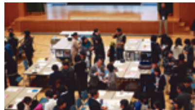
クロージングセッションで学びを共有する参加者の皆さん

午前は6つ、午後は7つのセッションから参加者が好きなものを選んで聴講。今年では50周年を記念して、隊員の経験を活かして国際協力や地域活性化のために活躍している方々のお話も多く、みなさん、信州と世界のつながりを感じることができたのではないのでしょうか。来年もご期待ください!