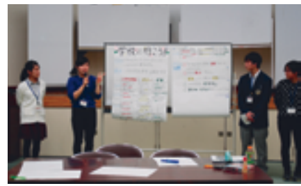
最終日、自分が隊員となったら何をするかをグループで発表

長野県教育委員会主催による初めての高校生の宿泊型研修を駒ヶ根訓練所にて行いました。県内の異なる高校から、1、2年生33名が参加。国際協力の理解や意識を高めるための内容で、ワークショップ、ネパール語講座、訓練期間中の訓練生と一緒に朝の集いや班活動に参加したり、訓練生へのインタビュー、そして世界の課題に取り組むための協力隊プロジェクト作成など、とても濃い2泊3日でした。中には「とても楽しくて、帰りたくない!」、「協力隊を目指したい。」と言ってくれる生徒さんも多くいました。