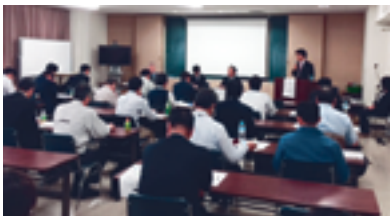
「中小企業海外展開支援事業セミナー in 飯田市」にて