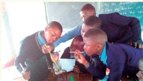
真剣な表情で実験に取り組む生徒