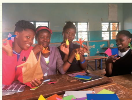
日本文化教室(折り紙作り)に参加した生徒