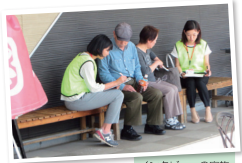
インタビューの実施

外部から来た人たちが、どうすれば農業体験などのイベントや施設を魅力的に感じることができるのか、訓練生たちが持つ外部者の視点から分析を行います。訓練生たちは利用者の声にも熱心に耳を傾けるなど、任国へ派遣後も必要な姿勢を、この協力活動(地域実践)を通じて学んでいます。