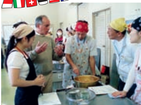
▲毎回大好評の「地球の料理教室」。今年のレシピはウルグアイの家庭料理

秋の伊那谷を国際色に染める「第16回みなこいワールドフェスタ」が10月18日から10月25日、盛大に行われました。「みなこい」は上伊那地域の宮田村、中川村、駒ヶ根市、飯島町の4市町村の頭文字をとったもの。駒ヶ根青年海外協力隊訓練所、駒ヶ根市、駒ヶ根協力隊を育てる会、駒ヶ根青年会議所等で結成した実行委員会が、約半年にわたりイベントの準備をしてきました。