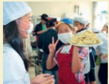
▲出前講座で、中米の料理に挑戦中！

JICAボランティア経験者や職員らを講師として派遣し、途上国の話や活動体験談などを行います。「海外の料理教室」も人気のメニューです。