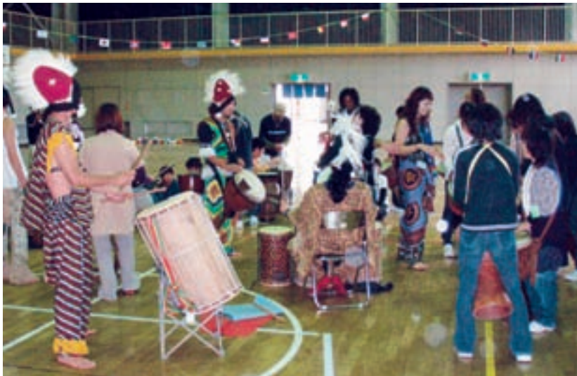
▲全校での取り組んだジャンベ（アフリカ太鼓）体験

「153人の村」で実施したアメ玉を富に見立て、世界の現状に即して分配するワークショップでは、「日本は（国土が）小さいのにもらいすぎ」「一人一つ手に入れるためには戦争で奪う」など、子どもたちは素直な気持ちで世界の状況をとらえていました。また、「ガーナの子どもは勉強ができるだけで幸せなんだなあと思いました。私たちは『勉強なんてやだな』とか『学校行きたくない』とか、すごくぜいたくなことを言っているんだと思いました。『当たり前』と知っていることが、一番考えなければならない大切なことだと思いました」と自分の姿を振り返る子ども。そして「国際支援の仕事をしてみたい」と将来の夢を持つ子ども…。