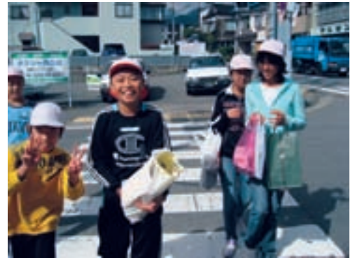
▲地域の方が寄付して下さった文房具を手に、嬉しそうな赤穂東小の子もたち

物資を送ることが最善の支援の方法ではないのかもしれませんが、子ども達に「互いに対等な関係であること」をどう伝えるか、現在私が感じている課題です。しかしこの活動の中で、子ども達が自分達にできる「何か」を見つけやってみたことに意味があったのではないかと考えています。そして彼らがいつかまた海外貧困問題と向き合ったとき、「他人事でない、自分もつながっている」と感じてくれたら幸いです。