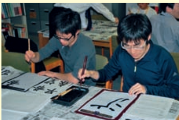
▲日本文化の紹介に向けて企画された書道教室

ように代々受け継がれ、これを元にして講師初体験に挑むボランティアもいます。任国の人々に伝え教え、共に企画することもあるボランティアたち。この講座は任国での活動の予行演習とも言えるでしょう。