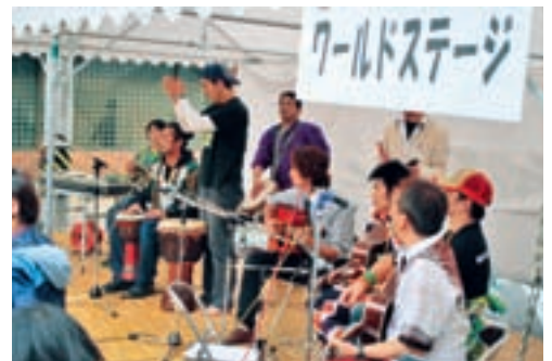
▲ワールドステージでは訓練中のJICAボランティアも大活躍!

クライマックスは25日、JR駒ヶ根駅前の大通りを会場とした「国際広場」。タイ、ニジェールなど世界各国の料理が食べられるレストランコーナーや、JICAボランティアが任国で使用する外国語学習体験ブースなどが設けられ、会場は国際色に染まりました。特設ステージではネパールの「ナマステ体操」やアラブのベリーダンスなどが披露され、訓練中のJICAボランティアも参加して、イベントを一層にぎやかに盛り上げました。