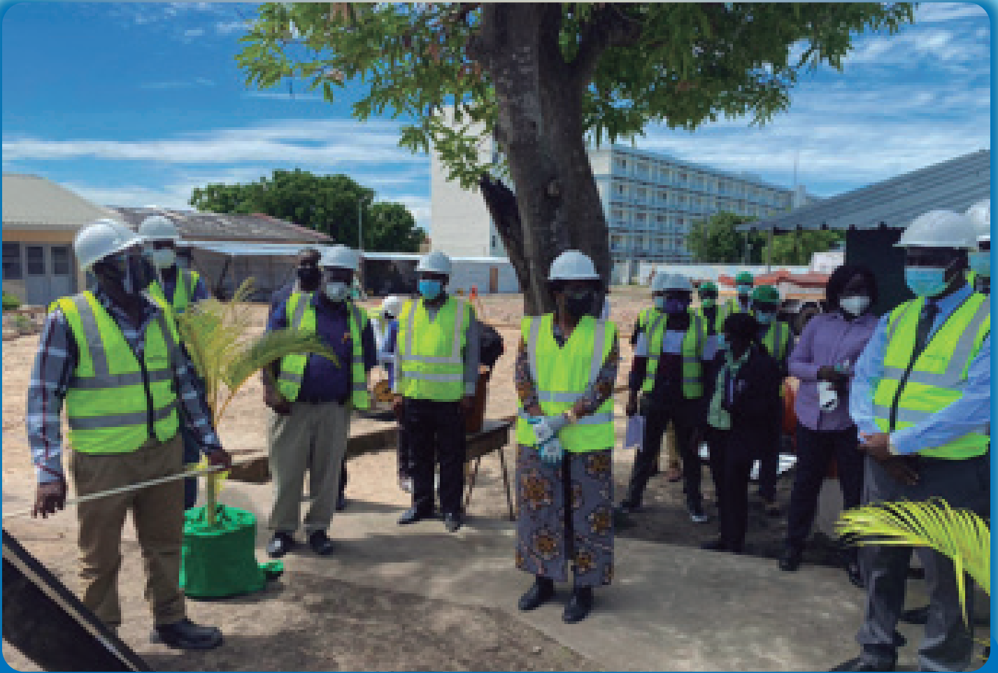
Cerimónia de lançamento 5 de Março ICS Beira

Decorrem desde fevereiro último, a ritmo satisfatório, as obras de reconstrução e reabilitação das infraestruturas públicas destruídas pelo ciclone IDAI na província de Sofala, sob o apoio da Agência Japonesa de Cooperação Internacional (JICA) através do Projecto de Fortalecimento da Resiliência nas Áreas afectadas pelo Ciclone IDAI (ARPOC).