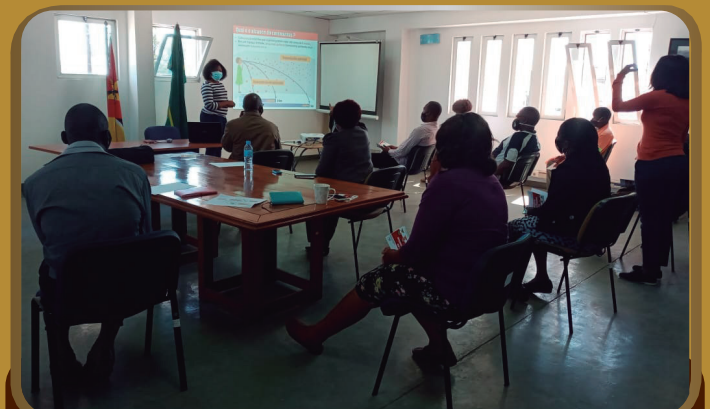
Treinamento para os funcionários da DSMAS sobre prevenção da Covid -19