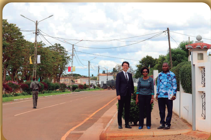
Governadora da Província de Niassa e a Estrada melhorada do Municipal de Lichinga