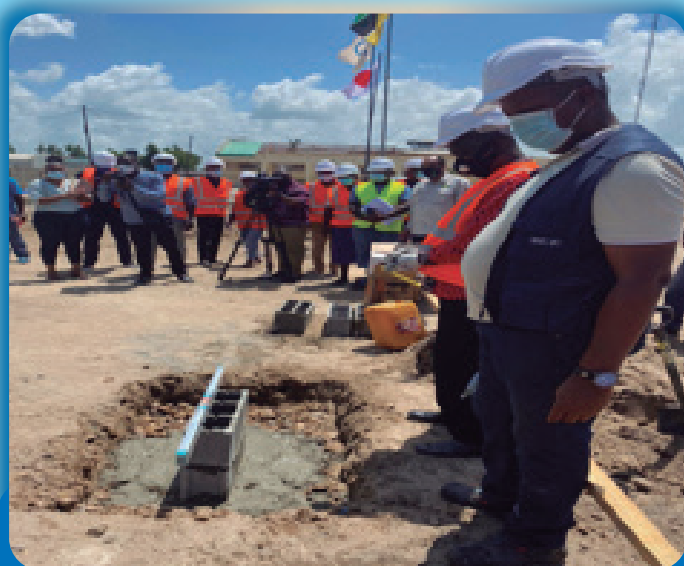
Cerimónia de lançamento 25 de Fevereiro EPC Macurungo

Este facto garantiu a redução dos efeitos sociais e económicos dos dois ciclones ao nível das comunidades.