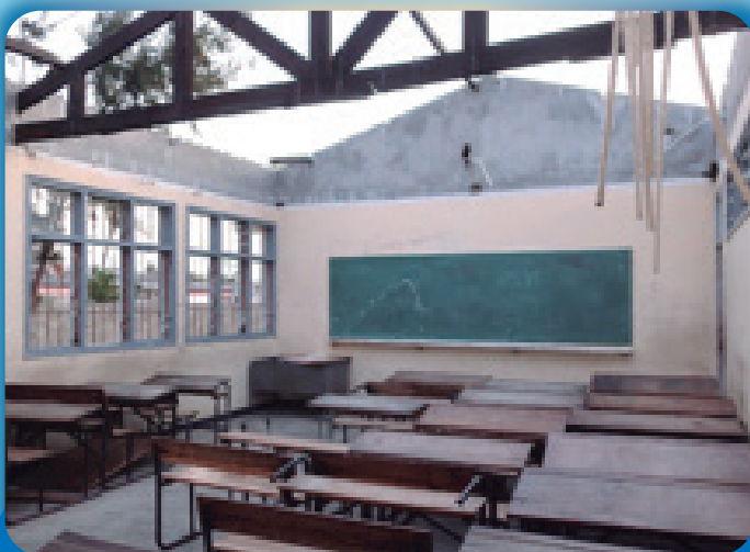
Foto da sala de aula após o ciclone IDAI