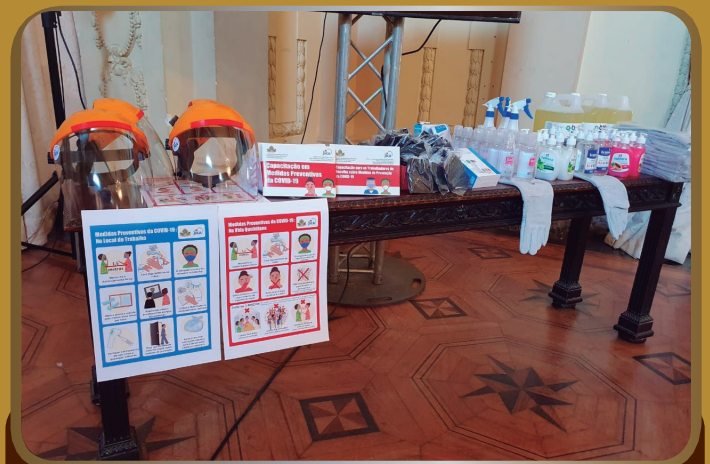
Equipamento de prevenção a COVID-19 entregue