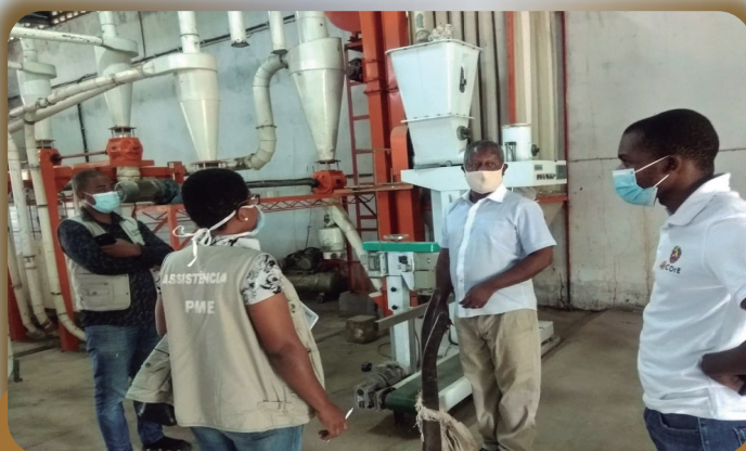
Equipe do IPEME fazendo assistência às PMEs

vendas, definição de uma visão de crescimento para alimentar o mercado local, regional e nacional, melhorar o sistema de registo das entradas e saídas dos produtos.