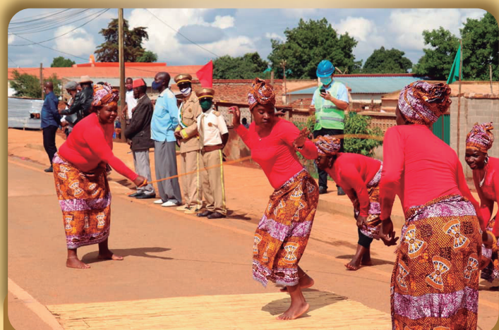
Dança da corda durante a cerimónia

A JICA tem cooperado no desenvolvimento de infraestruturas ao longo do Corredor Económico de Nacala, tais como o Porto de Nacala e mais de 600 km de estradas principais, com cofinanciamento do Banco Africano de Desenvolvimento e outras instituições. A melhoria e construção das estradas da Cidade de Lichinga são extensões do Projeto de Melhoria da Estrada Mandimba-Lichinga ao longo da Estrada Nacional EN-13.