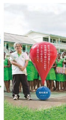
福島県内3カ所で開催!!

2015年度秋 ボランティア募集中! 僕たちに できることは 必ずある 募集期間 2015 10/1 -11/2 今すぐチェック! 青年海外協力隊 シニア海外ボランティア