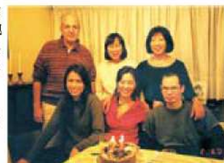
▲マリアさんとマリアさんのご家族