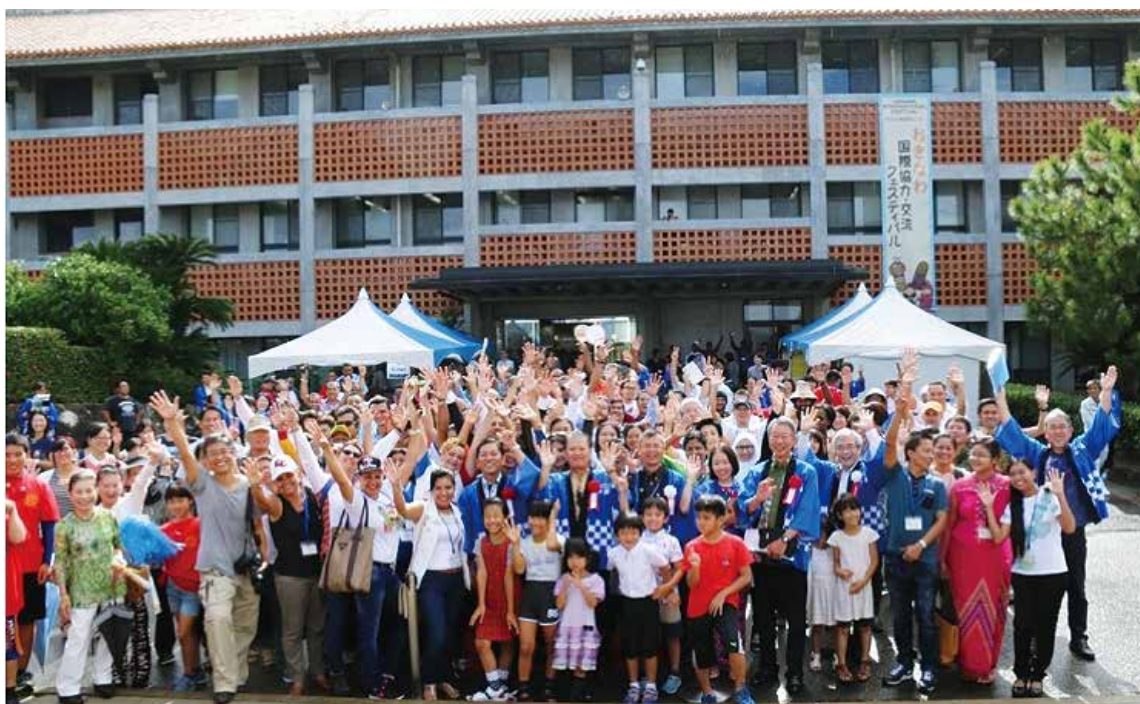
おきなわ国際協力・交流フェスティバル