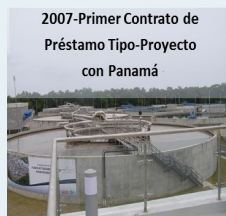
2007-Primer Contrato de Préstamo Tipo-Proyecto con Panamá