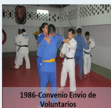
1986-Convenio Envío de Voluntarios