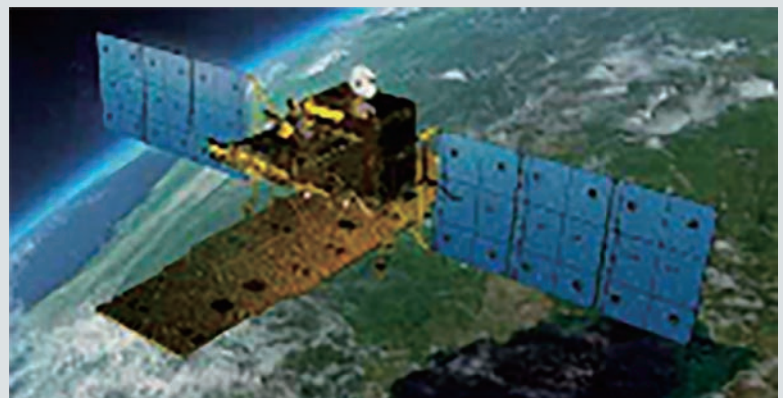
陸域観測技術衛星2号「だいち2号」