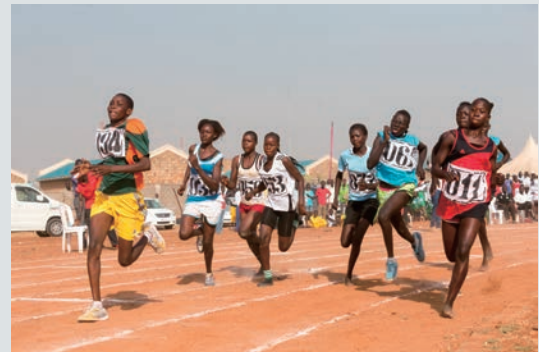
女子陸上競技800m決勝の様子

2011年に独立を果たした南スーダンですが、2013年の武力衝突以降、国内の治安が悪化し、暴力が繰り返される中、民族・部族間の不信感が増幅しました。JICAは国民間の信頼醸成と社会的結束を後押しするため、南スーダンの全国スポーツ大会「国民結束の日」に協力しています。大会では、300人超のアスリートがフェアプレーの精神で熱戦を繰り広げ、スポーツを通じ民族・部族の違いを超えた平和と和解・融和に向けた姿勢が育まれています。