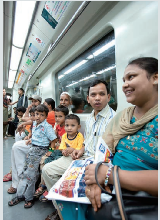
女性や子ども、障がい者も安心して乗車