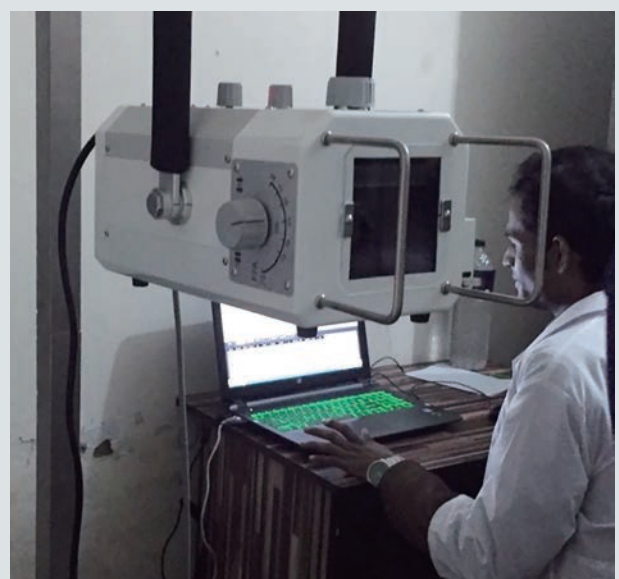
デジタルX線画像診断データを解析する様子

開発途上国でも、所得水準の向上に伴い、生活習慣病への対応が大きな課題となっています。JICAは、コニカミノルタ株式会社と東大発ベンチャー miup社と共に、バングラデシュ農村部の貧困層を対象とした健康診断ビジネスを試行しています。モバイル医療機器とICTを活用し、地方の診療所と都市部の医師を繋いだ遠隔診断に加え、人工知能AIを組み合わせることで、一次スクリーニングを自動化。貧困層も受診可能な安価な健診サービスの実現を目指しています。