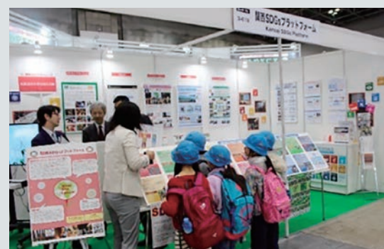
エコプロ2018に関西SDGsプラットフォームが出展

JICA関西センターは、近畿経済産業局と関西広域連合と共に「関西SDGsプラットフォーム」(KSP)を設置(2017年12月)しています。自治体、企業、大学、市民社会の多様な経験・知見を相互に結び付け、持続可能な社会の構築に向けた活動の加速化に取り組んでいます。KSPの会員数は1000団体を超え(2020年7月末時点)、SDGsに関するイベントの開催やホームページ等で積極的な情報発信が行われています。