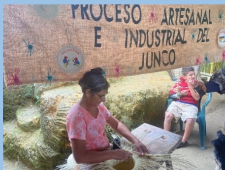
ホンジュラス国サンタバルバラ県の 手芸品製作販売の女性グループ