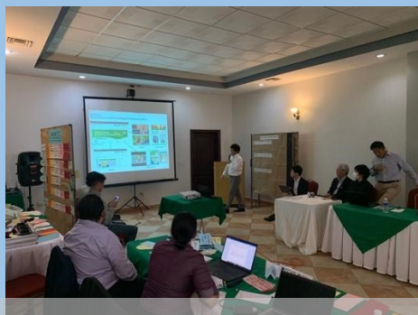
El seminario final del Proyecto en La Ceiba, Honduras