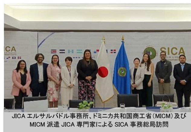
JICA エルサルバドル事務所、ドミニカ共和国商工省 (MICM) 及び MICM 派遣 JICA 専門家による SICA 事務総局訪問