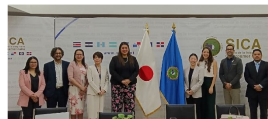
Encuentro entre SG-SICA, JICA El Salvador y misión de República Dominicana conformada por Ministerio de Industria, Comercio y MIPYMES - MICM junto con la experta de JICA asignada a MICM