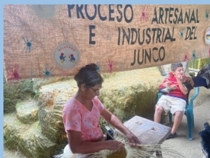
Grupo de las artesanas trabajando en producción de sombreros de junco, Departamento de Santa Bárbara, Honduras