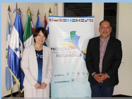
メソアメリカ統合開発プロジェクト代表との面談