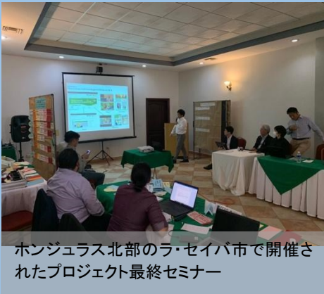
ホンジュラス北部のラ・セイバ市で開催されたプロジェクト最終セミナー