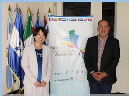
Con Director Ejecutivo del Proyecto de Integración y Desarrollo de Mesoamérica