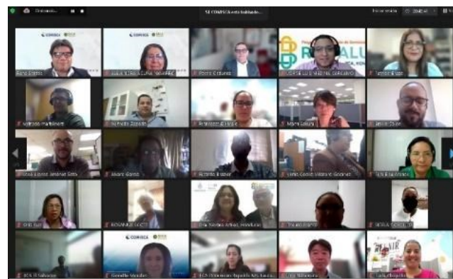
「SICA 加盟国における非感染性疾患の予防と管理」オンラインセミナーの様子 (2月20、21日開催)