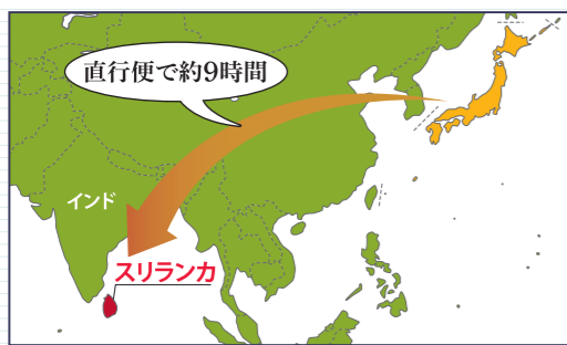
*スリランカ中央銀行年次報告書(2019年) **JETRO提供(2021年1月時点)