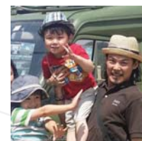
◎埼玉県さいたま市 アフリカを中心に事業を展開 IT専門学校ケニア 中古車輸出事業