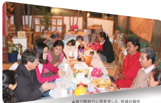
▲協力隊時代に再発見した、地域の個性