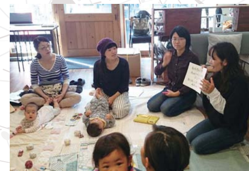
▲市委託事業の転入者向け地域情報交換サロン「まちナビ・サロン」の様子

人々がそれぞれの力を発揮して、和光市を変えていく原動力となり、その力が地域のアイデンティティとなっていく、大人の秘密基地arcoirisは、その発信元です。