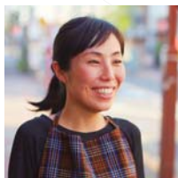
◎東京都葛飾区 Atlier 485