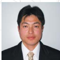
◎群馬県前橋市 群馬県農政部 技術支援課