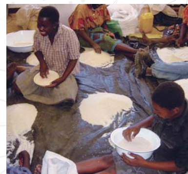
▲米の出荷前の品質管理を実施