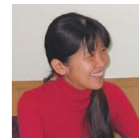
◎群馬県前橋市 病院勤務&「群馬の医療と言語・文化を考える会」