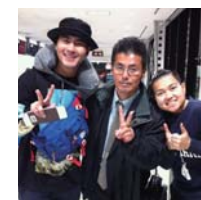
◎千葉県千葉市 千葉銀行