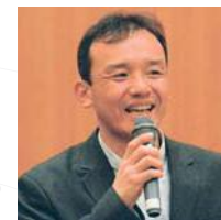
◎新潟県長岡市 公益社団法人 中越防災安全推進機構