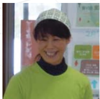
◎新潟県長岡市 NPO法人多世代交流館「にこニーナ」

青年海外協力隊で培われた力は、今、日本の地域を活性化する力として活用されています。その力は、やがて大きく成長し、世界を変える力として、さらに大きく羽ばたいていくことでしょう。世界の国々ために、そして私たちの国と地域社会のために。