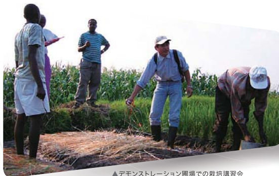
▲デモンストレーション圃場での栽培講習会