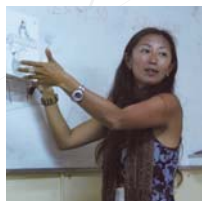
◎千葉県松戸市 学校勤務&日本語ボランティア