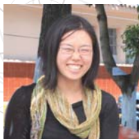
◎埼玉県和光市 コミュニティカフェ“arcoiris”経営