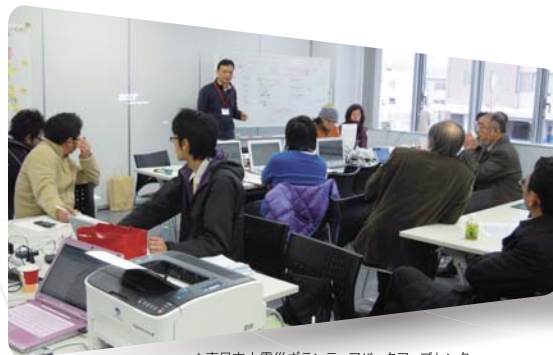
▲東日本大震災ボランティアバックアップセンターでの活動の様子

静岡県裾野市出身。青年海外協力隊に2回参加。1回目の派遣では森林のデータベース構築支援と日本式炭焼きの指導ならびに普及を実施。2回目の派遣では、農村の生活改善のため、農民グループや女性グループの組織化や農作物の生産向上などに取り組んだ。 (現在)新潟県長岡市 公益社団法人 中越防災安全推進機構