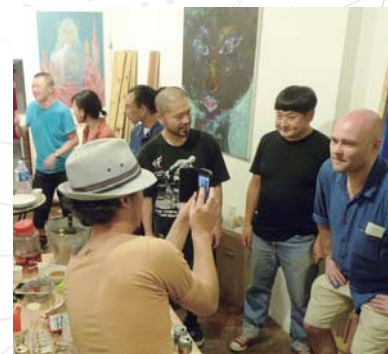
▲「川の間」イベントの1つとしてアトリエで作品を展示

チュニジアで聴覚障害者の社会参加を支援。その土地に根付く人々や文化と深く関わり合うことで見えてくる「地域の魅力」や「価値観の違い」を、葛飾の文化芸術振興と地域社会の「内なる国際化」に生かす。