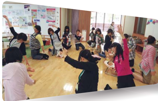
▲になこーなの「健康お茶会」の様子。 3つのサロン「子育てサロン」「手仕事カフェ」が他にあります。