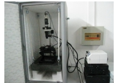
本事業で購入した顕微鏡（武漢科技大学）