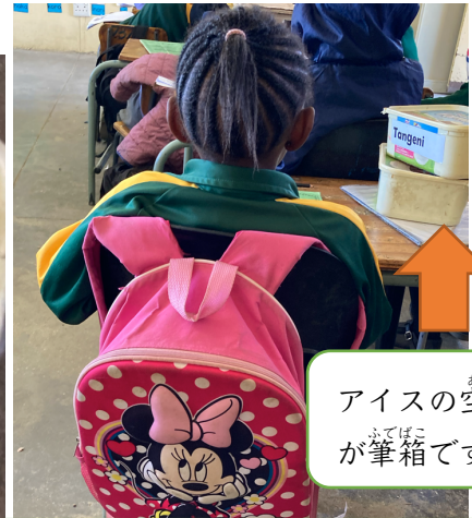
アイスの空き箱が筆箱です。

えんぴつ、色鉛筆、はさみだけでした。消しゴムやのりはありません。箱は学校に置いて帰っています。