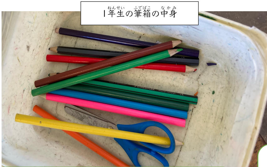
1年生の筆箱の中身

一部紹介しますね。日本の小学校との違いがたくさんあって、毎日驚きと発見があり楽しいです。