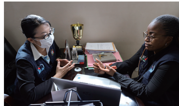
カニヤマ病院の事務長と打ち合わせをするニヤンガ専門家