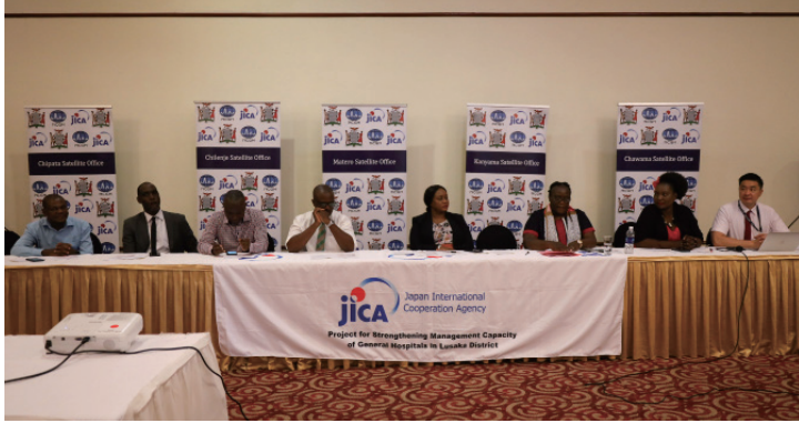
ルサカでの救急・重症患者ケアマネジメント交換プログラムの全体会議

州保健局のモニタリング・スーパービジョンの強化を通じて、2次-3次医療機関という異なるレベル間の第一線の医療従事者の間で、救急および重症患者管理に関する知識と技能の伝達を強化します。