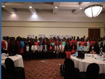
救急・重症患者ケアマネジメント交換プログラムにて、集合写真を撮る参加者たち