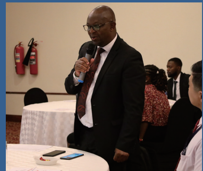
救急・重症患者ケアマネジメント交換プログラムにて、閉会の挨拶をするムシスカ郡保健局長