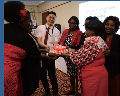
5つの総合病院の看護師長への感謝の気持ちを含めたケーキの贈呈（開催した2月14日はバレンタインのため）

最後に、ムシスカ郡保健局長は、カシオペアプロジェクトを実施するのJICAと出席メンバーに感謝するとともに、病院のマネジメント体制の構築と強化のために、保健施設に知識を共有し、互いに指導し合うことの重要性を強調しました。