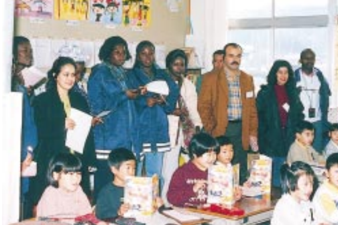
岡山県で小学校1年生の国語の授業を見学するアフリカ混成グループ