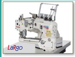
工業用ミシン「ラルゴ」 LaRgo 環縫い（かんぬい）ミシンです。

縫製業向けセミナーの会場風景（パキスタン） 右後ろの黄色い表示は、KAIZEN（改善）です。