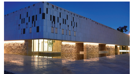
Le musée de Petra en Jordanie, a ouvert ses portes en 2019 grâce à un don de la JICA.

Bien que durement touchée par la pandémie de COVID-19, l'industrie du tourisme conserve un bon potentiel de croissance. La JICA met en œuvre des initiatives de développement touristique durable basées sur une perspective à long terme qui maximise les impacts positifs du tourisme, tels que les recettes en devises et la création d'emplois, tout en contrôlant les impacts négatifs sur l'environnement. La JICA travaille avec des organisations internationales et le secteur privé pour renforcer la coopération et la gestion des risques. Elle soutient en outre la construction d'infrastructures touristiques, la formulation de politiques de développement touristique, ainsi que le développement et la protection des ressources touristiques.