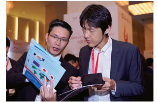
Un événement d'échange commercial entre des entreprises japonaises et vietnamiennes, organisé par l'Institut Vietnam-Japon pour le développement des ressources humaines (Centre Japon-Vietnam) en 2019.

La JICA renforce les fonctions de formation de réseaux humains et d'information des Centres Japon en les transformant en une plateforme de promotion des échanges de ressources humaines entre le Japon et les pays partenaires et en connectant les organisations concernées.