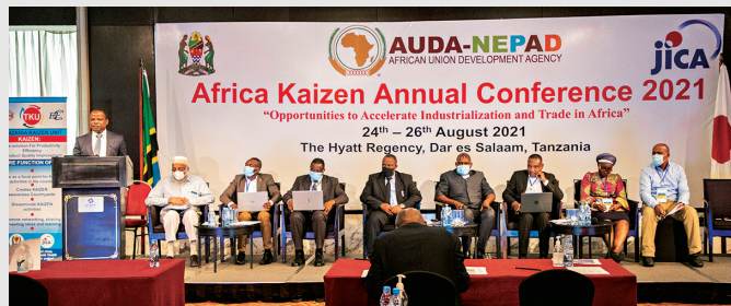
La conférence annuelle sur le Kaizen en Afrique s'est tenue en Tanzanie en août 2021, pour la première fois dans un format hybride, avec plus de 130 personnes présentes et plus de 160 participants en ligne.

Nous avons créé un système où le Kaizen peut aider les entreprises privées à croître efficacement, et nous sommes prêts à fournir une aide complète au développement des entreprises, notamment sur les aspects de gestion. Nous contribuons à l'industrialisation de l'Afrique.