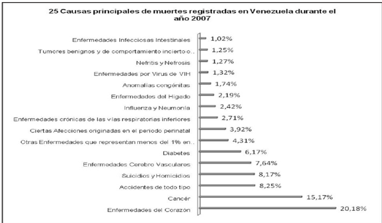
Gráfico N° 4. 25 causas principales de muertes registradas en Venezuela durante el año 2007

Fuente: Ministerio del Poder Popular para la Salud. Anuario de Mortalidad 2007.