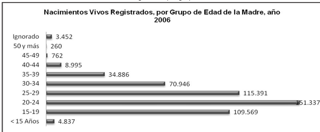
Gráfico N° 2. Nacimientos vivos registrados por grupos de edad de la madre. Año 2006