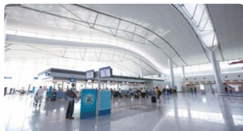
建造国际机场航站楼以方便人员和物资的流通(越南)

JICA通过经济政策等的支援，为促进该地区各国的宏观经济和公共财政的稳定提供必要的援助。而且，为了扩大民间投资，改善投资环境，JICA把可持续的经济开发所需要的基础设施开发及培养产业人才作为我们的重点加以推进。