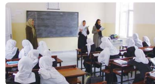
改善教学质量的基础教育援助(阿富汗)

作为国际社会的一员，JICA努力推进阿富汗、巴基斯坦和斯里兰卡的和平与稳定，为尼泊尔的民主化提供支持。尤其是根据邻国巴基斯坦政策情况为阿富汗提供了旨在促进地区稳定的援助。