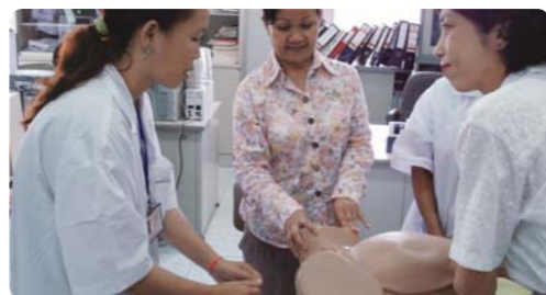
一位日本专家在一个卫生所里给助产士做技术指导(柬埔寨)

为缩小国家和地区间的差距，JICA通过改善贫困者生计、医疗卫生以及教育来提高基本社会服务和社区发展。例如，JICA正在为棉兰老岛的维和以及印尼东部的开发而努力。