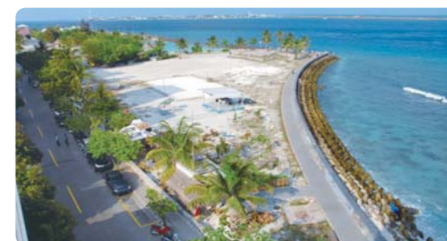
马累岛上沿海建起防护堤以减弱海啸的损害(马尔代夫)

鉴于因气候变化所带来的海平面上升和冰川消融等问题，在诸如巴基斯坦、孟加拉国、不丹和马尔代夫等国，JICA关注着灾害紧急援助以及预防灾害和灾后重建等问题。