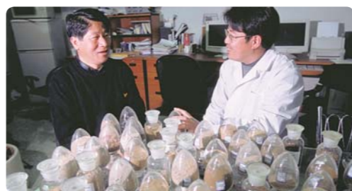
通过分析在沙漠地区收集的沙子来确定黄沙的发源地(中国)

为了应对中国及全球性环境问题，JICA有效利用日本的经验和帮助中国制定公害对策、保护生态环境、制定环境政策及培养人材。