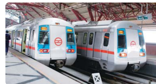
采用日本技术和经验建成的德里地铁(印度)

JICA对诸如印度等经济飞速发展的国家继续提供日元贷款用于包括交通和能源等的基础设施开发，同时也帮助他们解决因经济发展而导致的环境污染等问题。