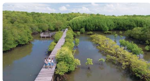
实施对控制气候变化有效的保护红树林项目(印度尼西亚)

随着ASEAN(东南亚国家联盟)在东南亚地区一体化的加强，JICA致力于解决包括环境保护、气候变化、对自然灾害的恢复重建、防灾、预防传染病及海上安全等内容的共同性课题。