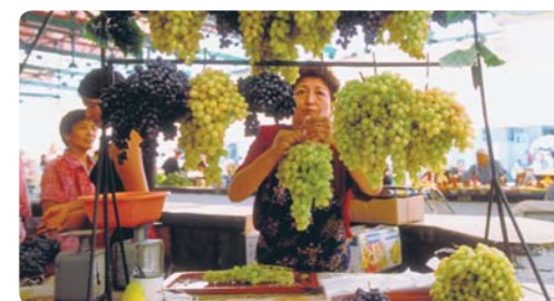
支持该地区通过向市场经济过渡而进行自主发展(吉尔吉斯斯坦)

在中亚和高加索，JICA按照包括“中亚加日本”对话在内的政府政策，援助发展中亚地区的交通基础设施，并支持各国通过以市场为导向的经济改革和乡村开发而减贫。