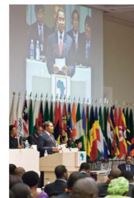
2008年5月在日本横滨召开的第四届东京非洲发展国际会议的开幕式

比如，在尼日尔，JICA 发起“通过社区参与以提高学校管理的计划”，通过提高社区对学校管理的参与以促进教育部门的资源普及。通过项目的实施，提高了当地社区对教育重要性的认识，并帮助他们筹集了用于改善教育系统必需的资金，从而显著提高了升学率。因为本项目的成功实施，尼日尔政府已经决定在世界银行日本社会发展基金