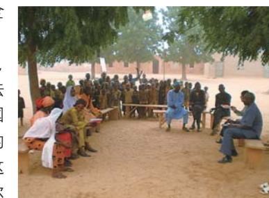
尼日尔，JICA 的职员在向一所小学的项目参与者询问《通过社区参与以提高学校管理的计划》的实行动态情况

该案例说明，JICA 项目实施的方法非常成功。发展中国家可以在世界银行的支持下改善并推广这一成果。除了尼日尔之外，在其他法语圈非洲国家(如塞内加尔、马里和布基纳法索)，JICA、世界银行和发展中国家也推广了类似的 JICA 项目，其方法超越了特定国家的条件限定，而成为适用于受日本社会发展基金支持的相关国家的方法。