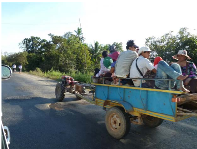
図-2 モトルモック 2