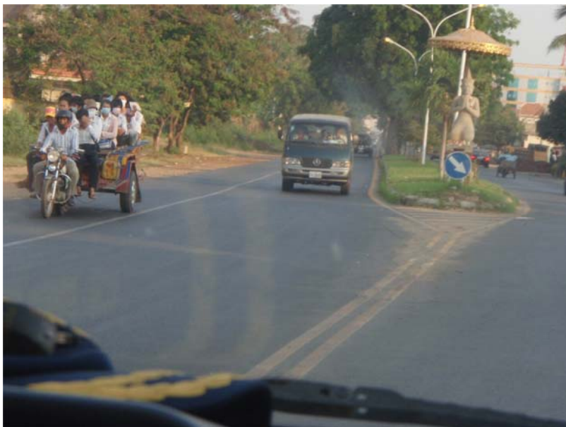
図-1 モトルモック 1