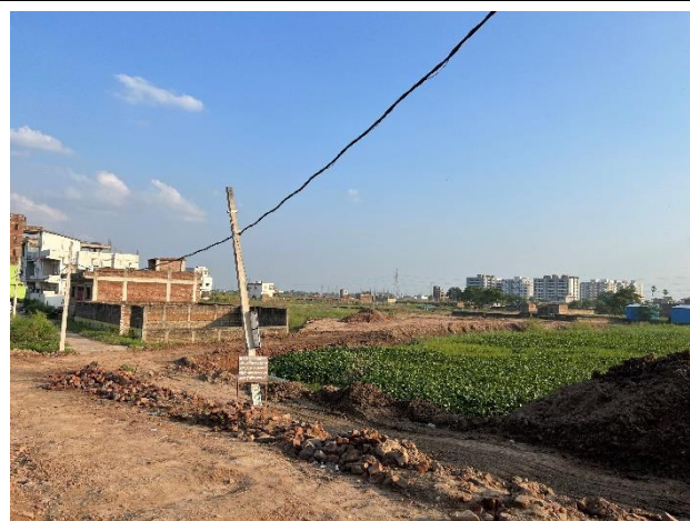
車両基地建設予定地