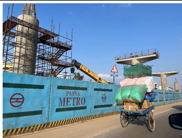
建設中の高架区間の様子