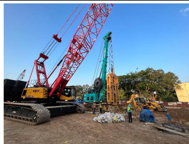
建設中の地下区間の様子