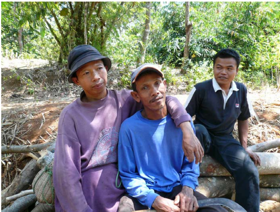
現地の農業労働者

・EIAにおいても住民移転計画書においても影響を受けるステークホルダーとみなされず、協議がされていなかった (2007年9月時点)