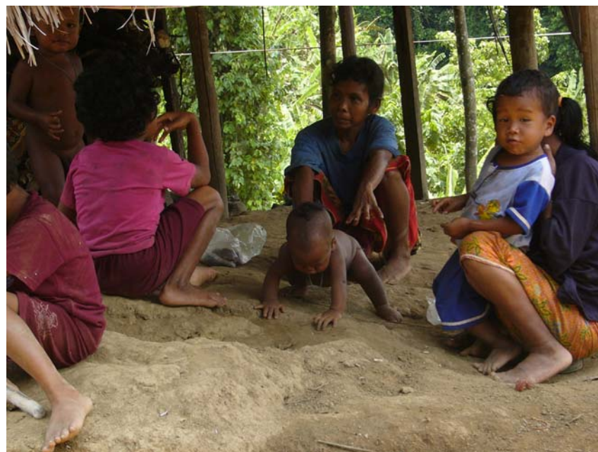
移転対象となっている先住民族