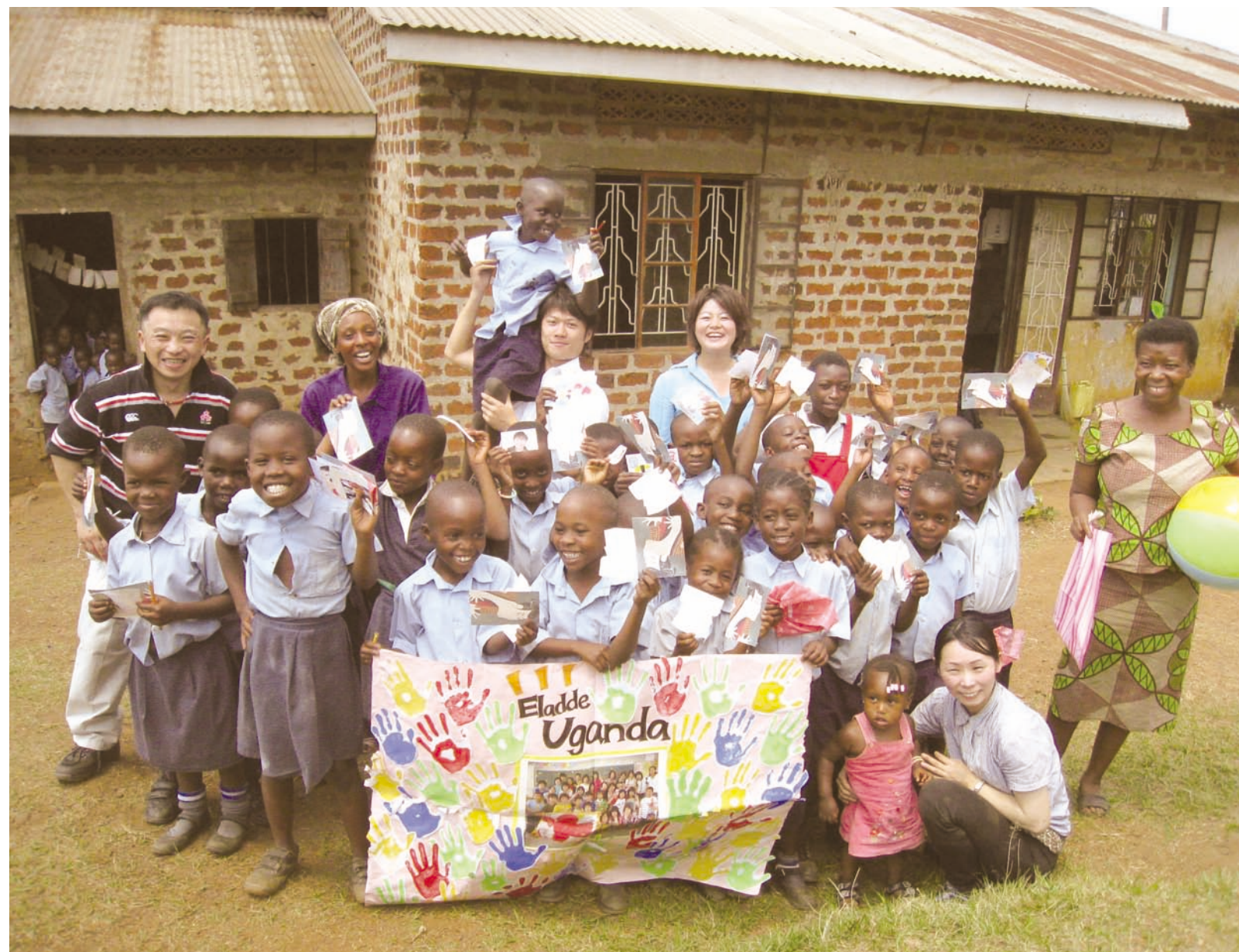
写真：「日本のみんなとつながっているよ」 金沢市立伏見台小学校の子どもたちから手形アートのプレゼント。(教師海外研修 ウガンダ)