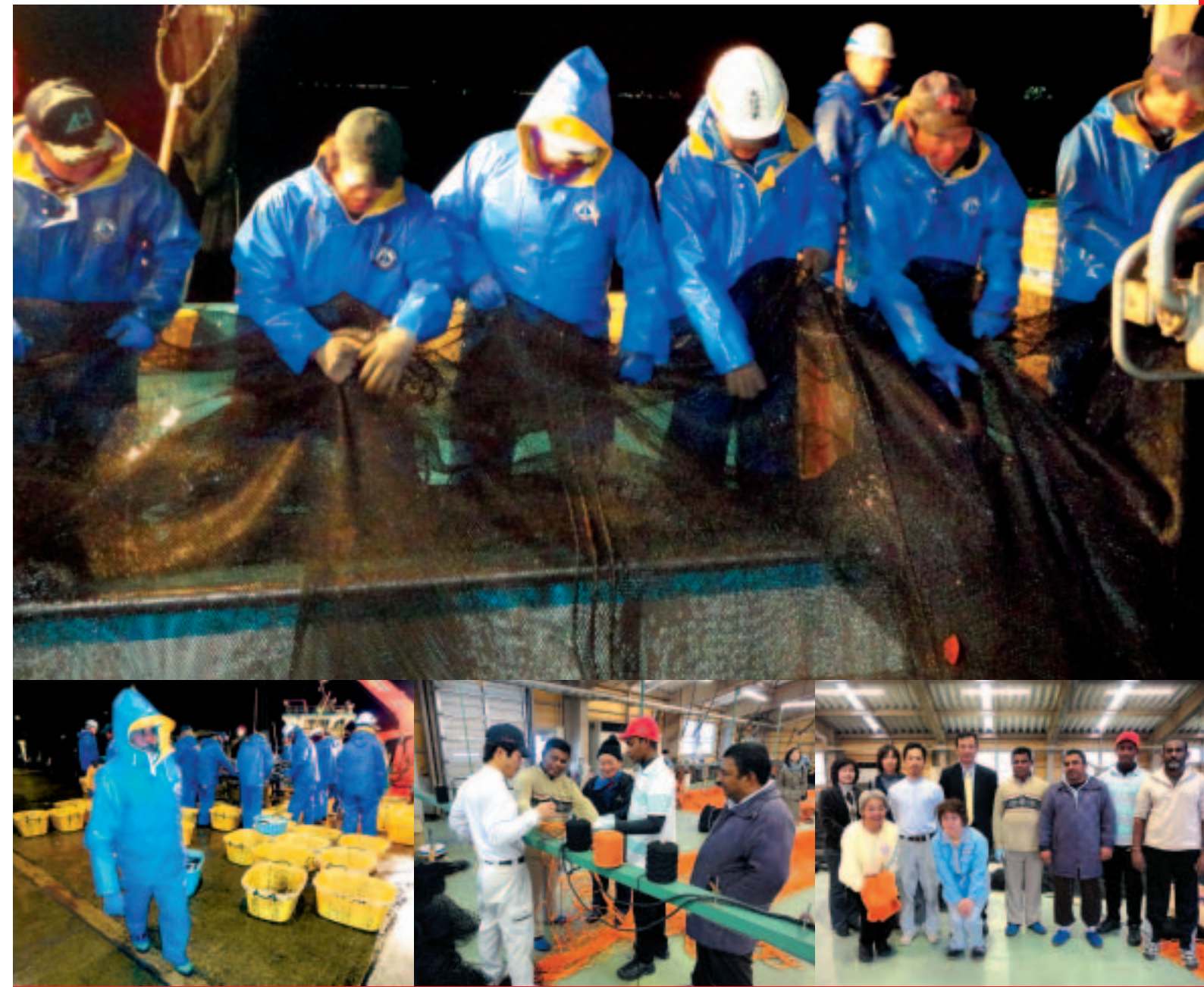
写真: 富山県富山市「四方漁港」・水見市「日東製鋼株式会社」にて定置網漁業の包括的技術研修を受けるスリランカからの研修員 (実施団体: NPO法人地球の夢)

JICAボランティアOB OGのみなさんへ体験談を募集しています。JICA北陸広報までご連絡下さい。