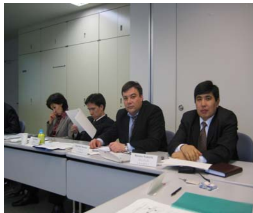
Четыре участника из Кыргызстана в Японии

А полезность самого курса была наивысшая благодаря методике обучения, которая построена так чтобы участники не ограничивались только получением теоретических знаний, но и посещая ряд объектов (например, сельхозкооперативы, завод Тойоты, туристические центры, научно-производственные центры и т.п.) своими глазами увидели основные результаты государственной региональной политики, их практического применения и значимости.