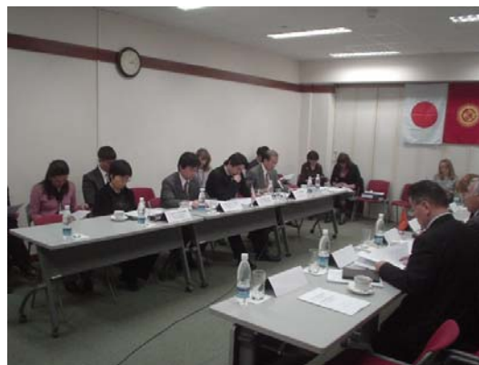
Подписание Протокола Переговоров о начале II фазы Проекта

За 5 лет своей деятельности, Центр, будучи своеобразным и единственным в своем роде «мостом» дружбы и взаимопонимания между народами Кыргызстана и Японии, стал хорошо известен как предпринимателям Кыргызстана, так и тем, кто изучает японский язык и японскую культуру. За это время на бизнес курсах Центра прошли обучение около 3000 предпринимателей, на курсах японского языка - около 600 человек, а количество посетителей на ежегодные фестивали и музыкальные мероприятия исчисляется многими тысячами.