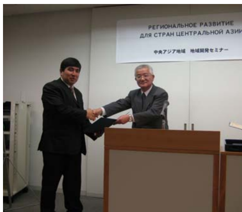
Вручение сертификата участнику курса

Теоретические лекции, такие как история экономического развития Японии, экономика «мыльного пузыря», теория экономических циклов, политическая экономия Японии, Японская модель рыночной экономики, экономическая теория эгалитаризма и т.п., дали возможность получить более конкретное представление для углубленного изучения современной Японской политической экономии регионального развития.