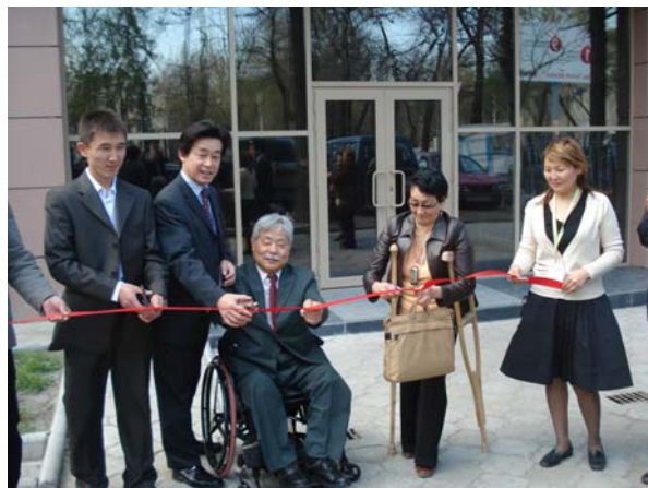
Церемония открытия построенного пандуса

Несмотря на наличие лифтов, чтобы добраться до офиса на 10 этаже, необходимо было произвести некоторые реконструкционные работы улучшения доступа - обеспечение пандуса и установки поручней в туалетных помещениях. Владелец здания поддержал идею, выдвинутую JICA о создании такой инфраструктуры.