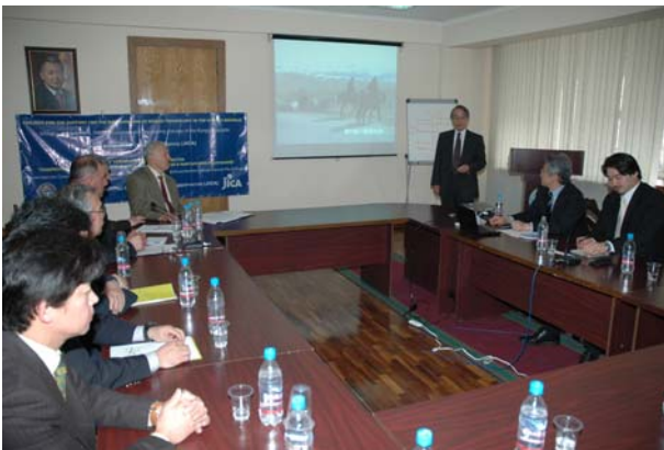
Участники семинара во время презентации

14 марта 2008 года в зале заседаний Министерства сельского, водного хозяйства и перерабатывающей промышленности Кыргызской Республики прошел семинар проекта JICA по техническому сотрудничеству «Содействие распространению биогазовых технологий в Кыргызской Республике», где приняли участие представители МСВХИПП, JICA в Кыргызской Республике, Посольства Японии в КР, международных организаций, НПО, профессора из университета Обихиро и журналист газеты «Токачи Майничи» (Япония).