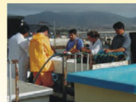
Cultivo de Moluscos