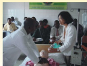
Capacitación para fortalecer las funciones del Hospital Josina Machel