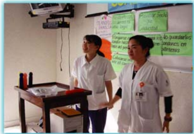
Enfermeras. Plática sobre el uso correcto del condón.

NOTA. ...Éstas son sólo las principales áreas del Programa de Jóvenes Voluntarios, sin embargo, existen más especialidades. Para conocerlas contacte con el Coordinador de Voluntarios Jóvenes.