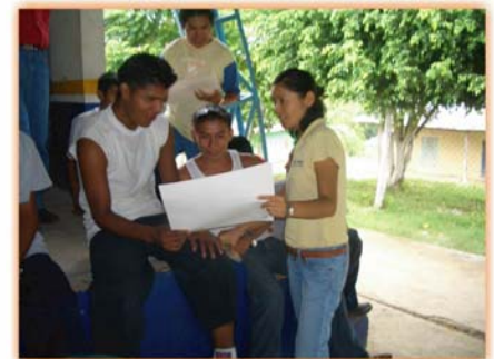
Enfermera en Salud Pública. Dando plática sobre violencia intrafamiliar con alumnos de preparatoria.