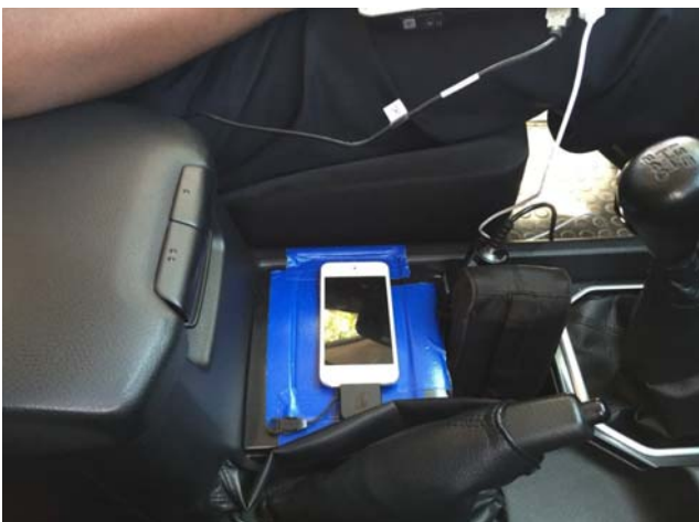
図3: iDRIMS (スマートフォン型)