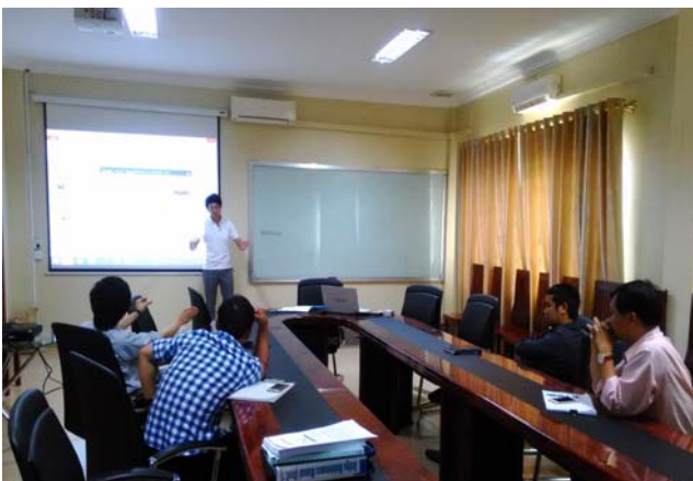
図1: チャオ氏による 講義の様子