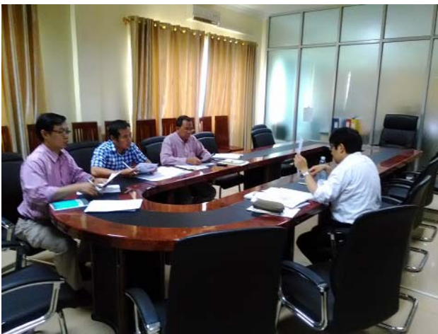
図1：橋梁維持管理マニュアル作成状況

本プロジェクトでは、MPWT のスタッフと共同で「橋梁維持管理マニュアル」を作成している(図1)。このマニュアルは、カンボジアで初の橋梁点検に関するガイドラインとなる。マニュアル策定にあたっては、現地調査結果も反映させていく予定(図2)である。