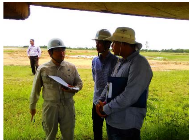
図4：DPWT職員へのヒヤリング