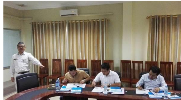
RID/ME メンバーがマスター・トレーナー試験実施状況