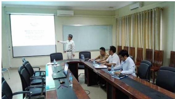
JICA Expert から RID/ME に道路メンテナンス新ガイドラインの概要を説明する様子