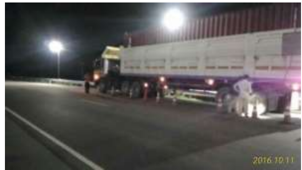
夜間における軸重計測 (2016年10月11日)