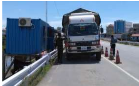
臨時管理事務所における軸重計測の様子