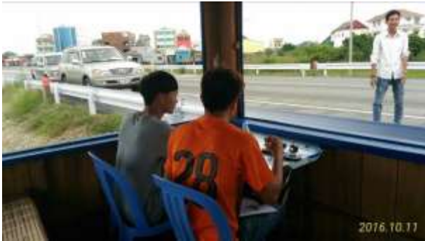
交通量調査 (2016年10月11日)

本パイロットプロジェクトは2017年8月頃までMPWT(メインカウンタパートは Secretariat of Permanent Coordination Committee for Inspection of Overloaded Trucks)と協働で実施する予定。