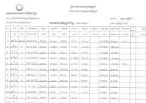
記録フォームの改善