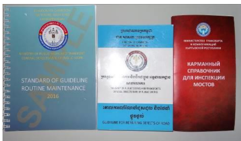
図 4 JICA プロジェクトチームがDPWTに紹介した3種類のハンドブック