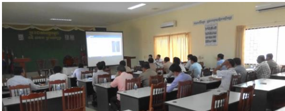
図 3 2016年12月16日にコンポンチャム周辺の5州のDPWTを対象として実施された公聴会の様子