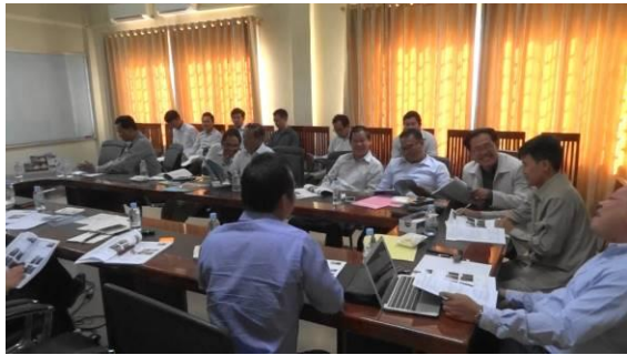
図 2 2016年12月14日にプノンペン周辺の5州のDPWTを対象として実施された公聴会の様子