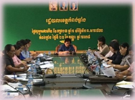
コンポンチュナン州 第4回WEEワーキンググループ会合（2018年9月）