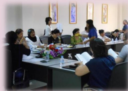
ジェンダー用語集改訂キックオフミーティング（2018年9月）

JICAホームページ、JICAカンボジア事務所のFacebookでも随時活動をご紹介します。 https://www.jica.go.jp/project/cambodia/023/index.html https://www.facebook.com/JICACambodia/