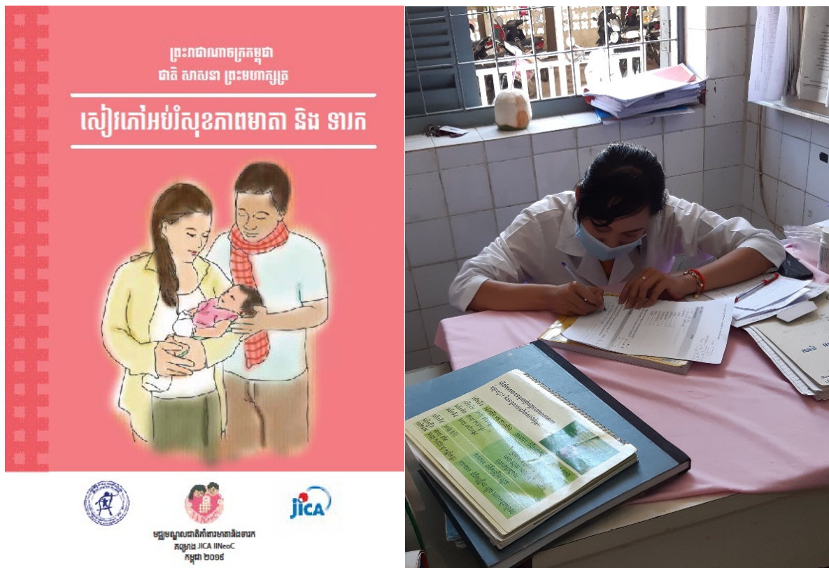
Picture: MCH Handbook and a Healthcare Worker Answering the Questionnaires

The IINeoC project has started the post-survey of “Evaluation of the Maternal and Child Health Educational Handbook” in the pilot sites of Svay Rieng Province for both mothers and healthcare workers. The purposes of the survey are to evaluate the effectiveness and usability of the Maternal and Child Handbook in improving the knowledge of the mothers and healthcare workers on the danger signs of pregnant women and babies, as well as raising the awareness of suitable frequency for postnatal care visits.